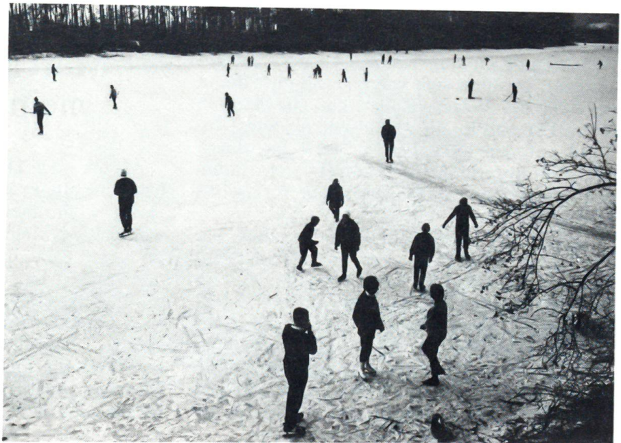
Die Kälte im Januar 1985

Werfen wir noch einen Blick auf ausländische Fremdenführer. Zum Beispiel auf jene mittelalterlich uniformierten Herren, die sich wie Lords benehmen und mit englischer Sachlichkeit den Fremden im Londoner Tower von Tatort zu Tatort führen, da einen Meuchelmord, dort eine Folterszene, hier eine Hinrichtung schildernd, so dass man davon überzeugt ist, dass die englische Geschichte auch nicht mit jenem Dünnbier geschrieben wurde, das man in London bekommt, wenn nicht gerade,