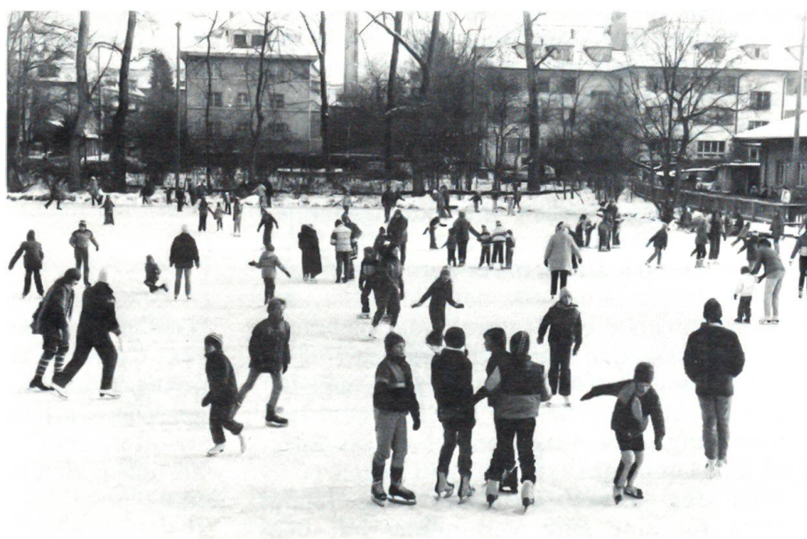
Die Kälte im Januar 1985

Jene Fremdenführer, die ihre Gefolgschaft mit der finsternen Entschlossenheit durch die Gemächer führen wie Hannibal seine Elefanten über die Alpen, haben auch keinen Sinn dafür, dass man durch ihre Sehenswürdigkeiten in heitere Stimmung versetzt wird. Das Tintenfass, mit dem Samuel der Sanfte seinen Bruder Simon meuchlings zu erschlagen geruhte, der Radiergummi, mit dem Kuno der Keusche die Muttermale auf dem Rücken seiner Geliebten zu entfernen pflegte, und der