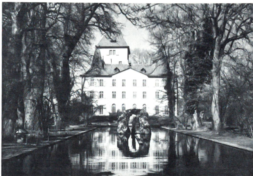
Oase der Stille

Wollte er sich einen Witz leisten, salopp-spielerisch sich vor den Augen des Mädchens brüsten, sich gar über Herrn Alfred lustig machen, kurz, verdiente die Angelegenheit Gelächter oder Vorwurf oder Schlimmeres? Doch, wie schon gesagt, Herr Gouache trug ein Endchen Kindergemüt in seiner Seele, dem es nicht möglich war, die Sache als schwerwiegend zu betrachten. Es lachte aus ihm heraus, ehe er sich darüber völlig klar war, welche Haltung ihm als Chef zukam. Der Stein machte sich allzugut in seiner Anmassung, seine Gestalt war doch – Gouache hatte es schon in der Morgenfrühe erkannt – edel und rein, er war übrigens kein Urbrocken wie die Nachbarn, sondern ein Schliffprodukt, wenn auch ein natürliches, und Herr Frohbart hatte nicht gründlich genug gedacht. Diese Erkenntnis freute ihn ein wenig. Warum aber sollte der geschliffene Gewöhnliche nicht für eine Weile in der Nachbarschaft der Kostbaren und Feinen ruhen, da er doch einmal aus der Gosse gehoben und näherer Betrachtung zugeführt war? Man sieht,