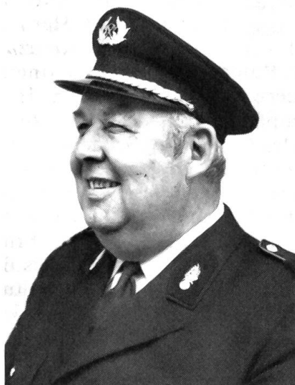
Major Otto Rüfenacht Vize-Kommandant der Berufsfeuerwehr der Stadt Bern, Bern † 1. November 1982