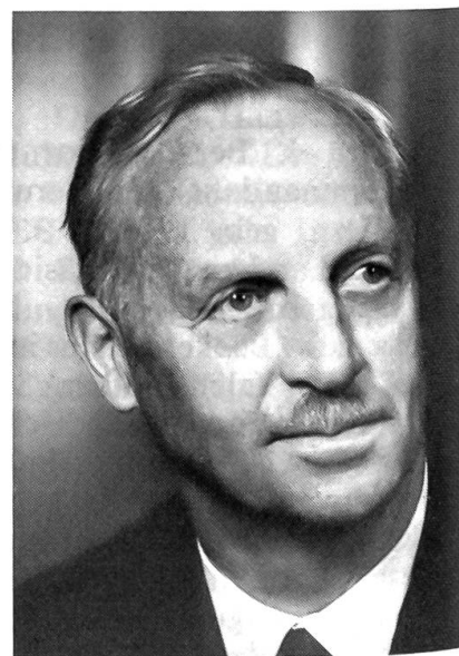
Hans Tschanz gew. Nationalrat und Präsident des Grossen Rates des Kantons Bern, Präsident des Bernischen Bauernverbandes, Grosshöchstetten † 12. November 1982