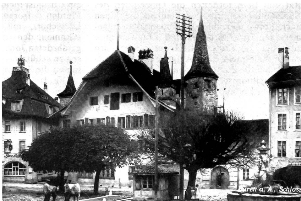
Büren a. d. A., Schloss

Photo etwa aus dem Jahr 1910 (Agentur Guggenheim Zürich) Schweizerische Landesbibliothek, Graphische Sammlung, Bern