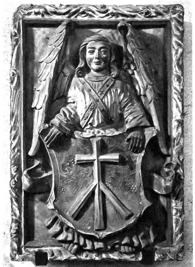
Prächtiger Wappenstein an einem Bürgerhaus in Büren a. d. A. Kunstdenkmäler des Kantons Bern, Photo † Martin Hesse

Den von der kirchlichen Oberbehörde oder von den einzelnen Dekanaten eingesetzten «Visitatoren» oder «Juraten» (Beeidigten) wurde in einer Ordnung von 1587 die Aufgabe überbunden, bei Amtsleuten und Chorgerichten zu erfragen, ob der Pfarrer viel im Wirtshaus sitze. Traf es auch den Hans Hutmacher, Helfer zu Büren? Er wurde wegen eines «an-