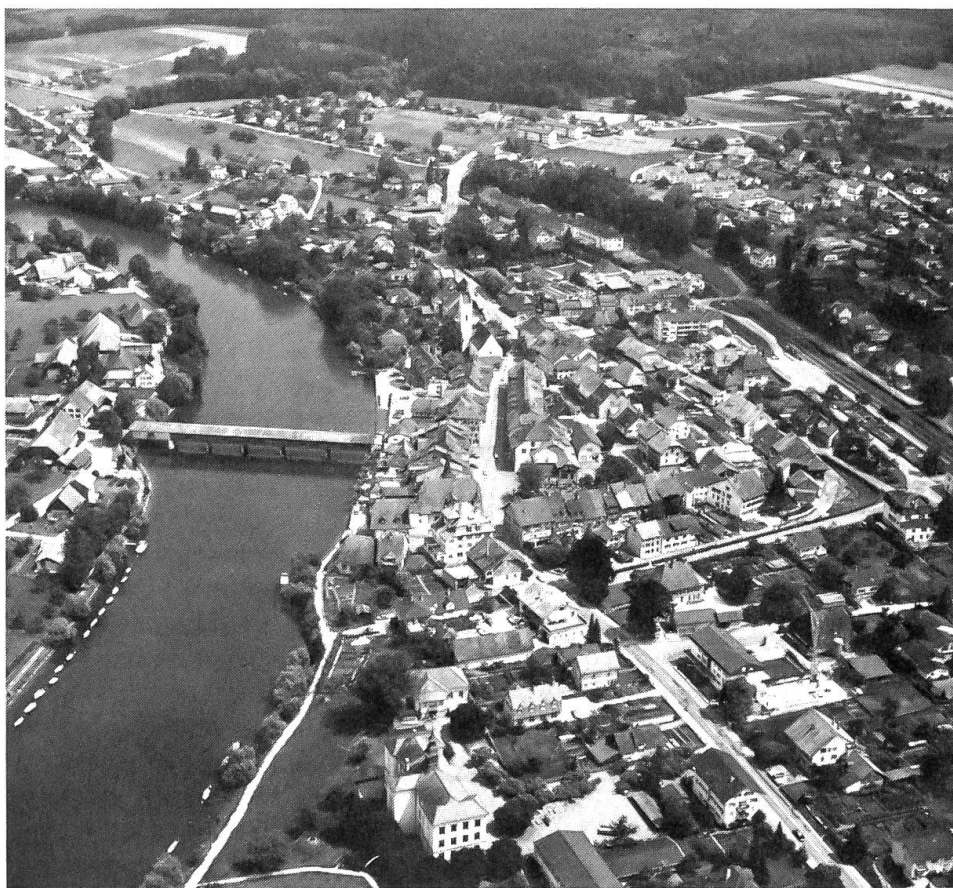
Büren a. d. A., Flugaufnahme (1978)

Verschwunden ist auch das «Belvedere», ein «Vergnügungsetablisement» in aussichtsreicher Lage im Süden des Städtchens – 1874 als «Sommerwirtschaft» neu eingerichtet, wurden seine Gebäulichkeiten nach mancherlei Hand-