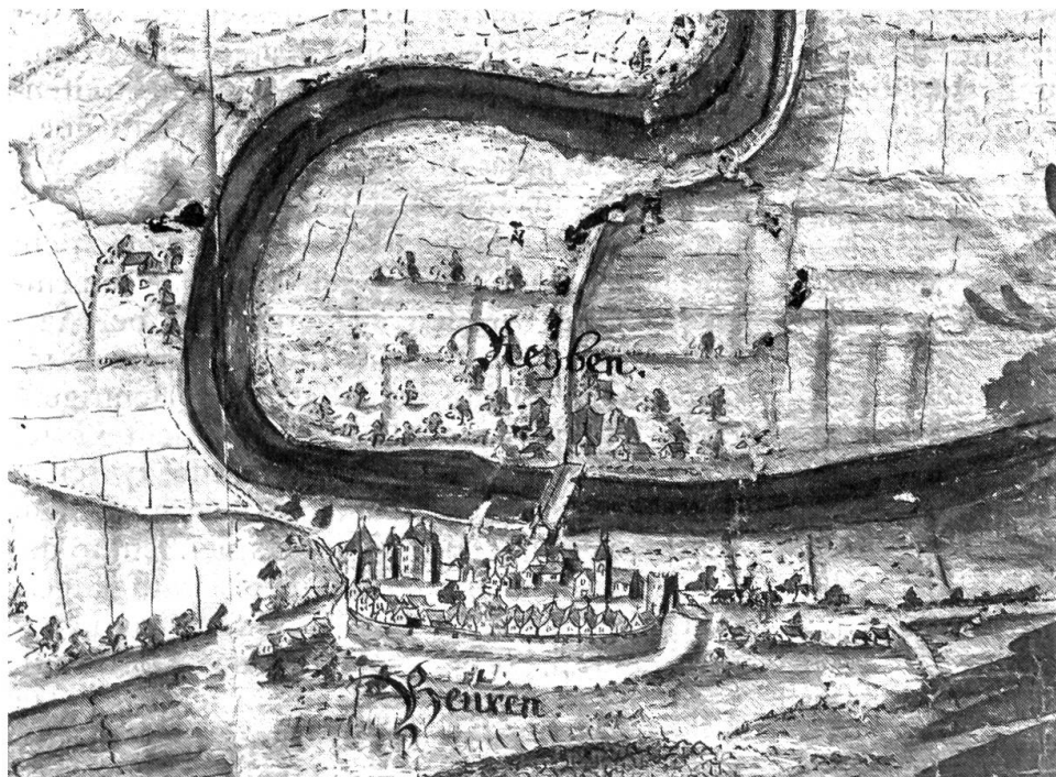
Büren a. d. A., Kartenausschnitt

Die teilweise mit Lauben geschmückten Bauten aus Stein, ein-, später zweigeschossig und mehr. Zu ebener Erde ein Mantel aus Mauerwerk, darüber Riegbau. Die Fassaden mit einem getönten Kalkbewurf gedeckt, Fenster und Türgewände aus Sand- oder Solothurner Kalkstein. Unter dem Giebel oder an den traufseitig angebrachten Dachluken die Aufzüge für Heu und Holz. Die an die Stadtmauer anstossenden Gebäude der «Hintern Gassen» von beträchtli-