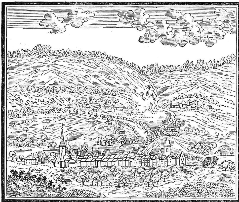
Ansicht der Stadt Büren

Es gab oder gibt noch anderes. Die Tore, die Türme, die Brunnen, die Ländte, Zeugen der