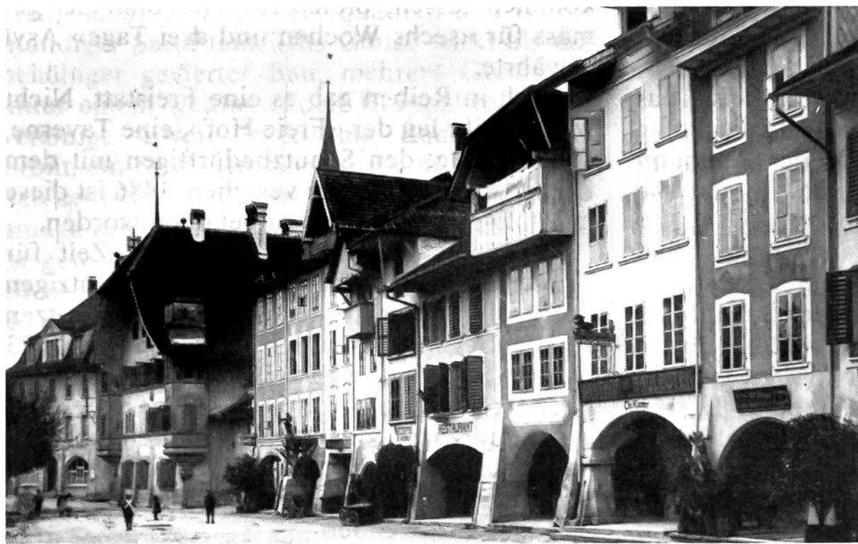
Büren a. d. A.