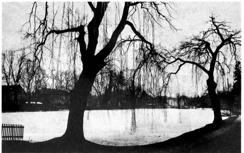
Winterstimmung Trauerweiden am Rande des Eisfeldes des Egelsees in Bern.

Zwar blieb der Stall in der ersten Zeit nach unserem Einzug noch verwaist. Mein Vater