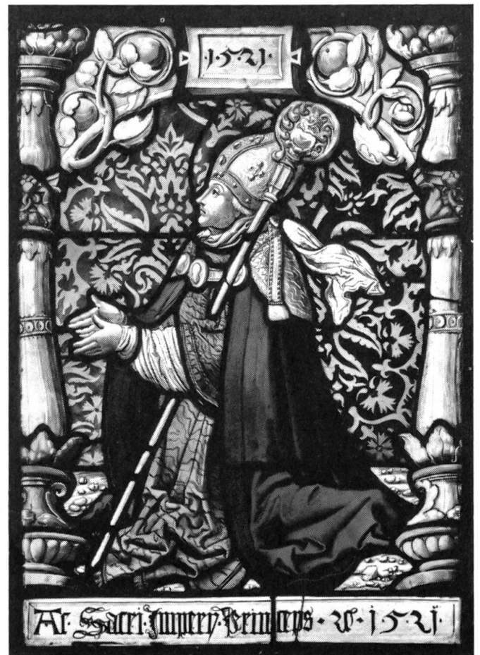
Bedeutende Glasmalereien in der Kirche Worb

Die bereits genannte Sekundarschule war die erste im Amt Konolfingen. Im Bürenstock, später im Hubelstock fand sie ihre vorläufigen Unterkünfte. 1856 wurde sie von der Gemeinde übernommen und erhielt auf der Besetzung der Tabakfabrik Hofmann ein neues Domizil. Auch sie mehrte gegen Ende des Jahrhunderts ihre Klassen. So liess sich die vorübergehende Hausgemeinschaft mit der Pri-