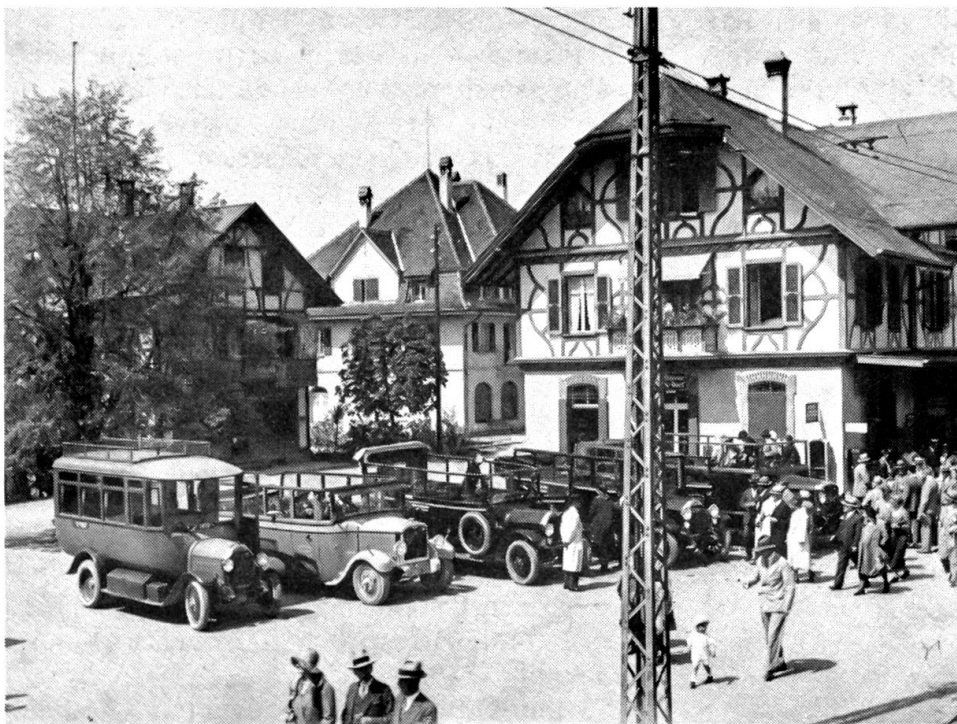
Postautostation beim Bahnhof Worb um 1929

In religiös bewegter Zeit ist die neue Kirche in Worb eingeweiht worden. Luther hatte im gleichen Jahr den Weg nach Worms angetreten und auf dem Reichstag eine «gereinigte», romfeindliche Auffassung des evangelischen Glaubens verkündet. Rom und Wittenberg lagen weitab, bald aber zündete der neue Geist in allernächster Nähe von Worb. Im Wallfahrtskirchlein von Kleinhöchstetten predigte Jörg Brunner gegen «Opfer» und «gute Werke» als Bedingung zur Sündenvergebung. Kühn nannte er den Papst den «entchrist» (Antichrist). Brunner erhielt grossen Zulauf «usz andren dörffern dasselb», und dadurch lichteten sich in den Kirchenbänken der nachbarlichen Gotteshäuser die Reihen der Gläubigen – die Opfer flossen spärlicher, die Einkünfte