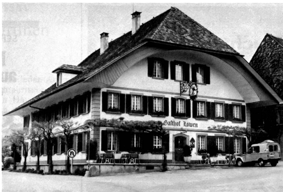
Gasthof Löwen in Worb

Bereits 1931 kam es zum Ankauf der Sternmatte mit dem Ziel, eine Sport- und Schwimmanlage zu errichten, ein Vorhaben, das um die Mitte der dreissiger Jahre ausgeführt wurde. Spätere Planungen sahen auf der Hofmatt ein Sportzentrum vor. Verwirklicht wurde bis heute die Tennisanlage, die im Winter in eine Kunsteisbahn umgewandelt wird.