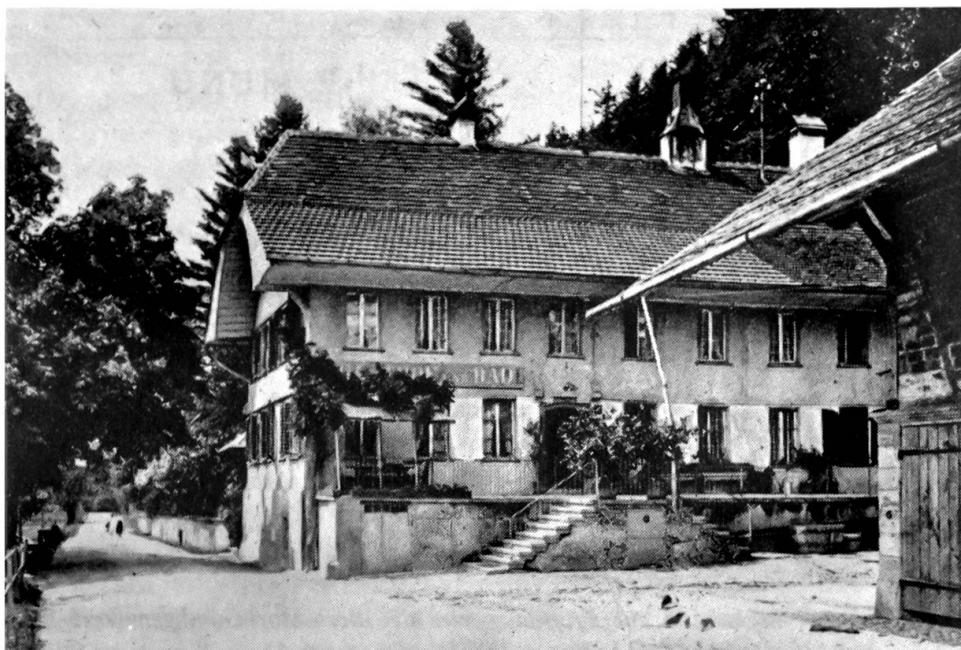
Bad Enggistein bei Worb

Kunstdenkmäler des Kantons Bern, Photo Gerhard Howald, Kirchlindach-Bern