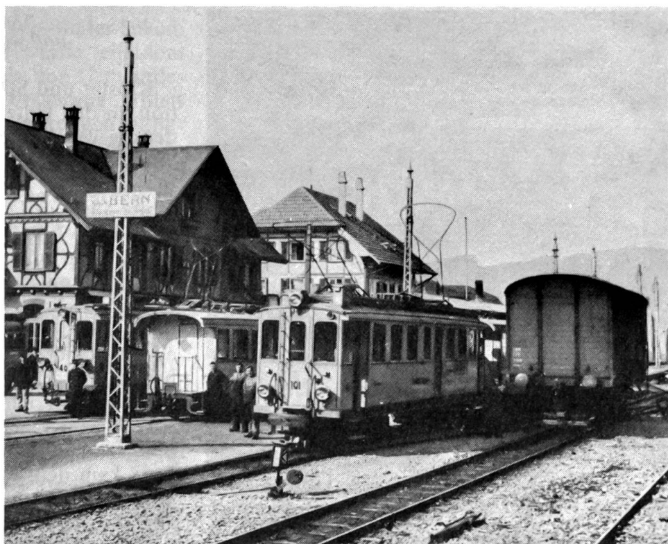
Bahnhof Worb um 1920