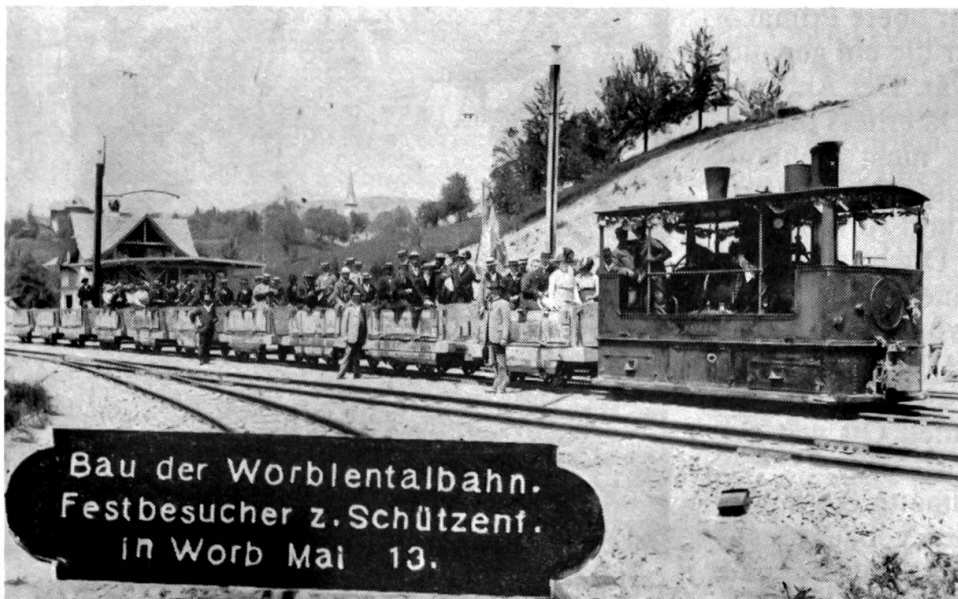
Die Worblentalbahn 1913 Anlässlich des damaligen Schützenfestes in Worb wurden zum Transport der vielen Fahrgäste diese Dampflokomotive eingesetzt, obschon die Bahnlinie damals schon elektrifiziert war.

1961 ist die Viktoria-Stiftung von Wabern nach Richigen umgezogen, wo die dreissig bis fünfunddreissig schulpflichtigen Mädchen in einem zweckmässigen Heim eine ihren Fähigkeiten angemessene Ausbildung erhalten.