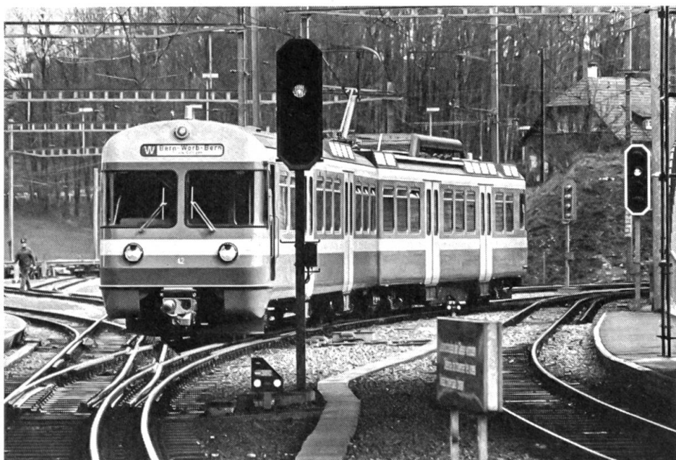
Moderne Vorortzugkomposition der VBW

Marksteine auch sonst. Die Elektrizität. In ihrer Nutzung ging Richigen den Dörfern der Nachbarschaft voran. Mit Unterstützung des dortigen Schlossinhabers (Richigen besitzt ein Herrenhaus, das der Familie von Wattenwyl gehört hat) er-