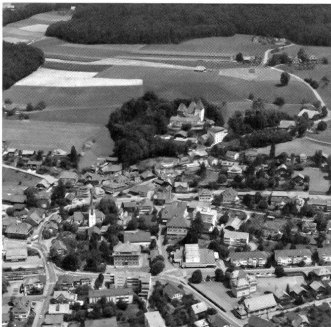
Flugaufnahme von Worb