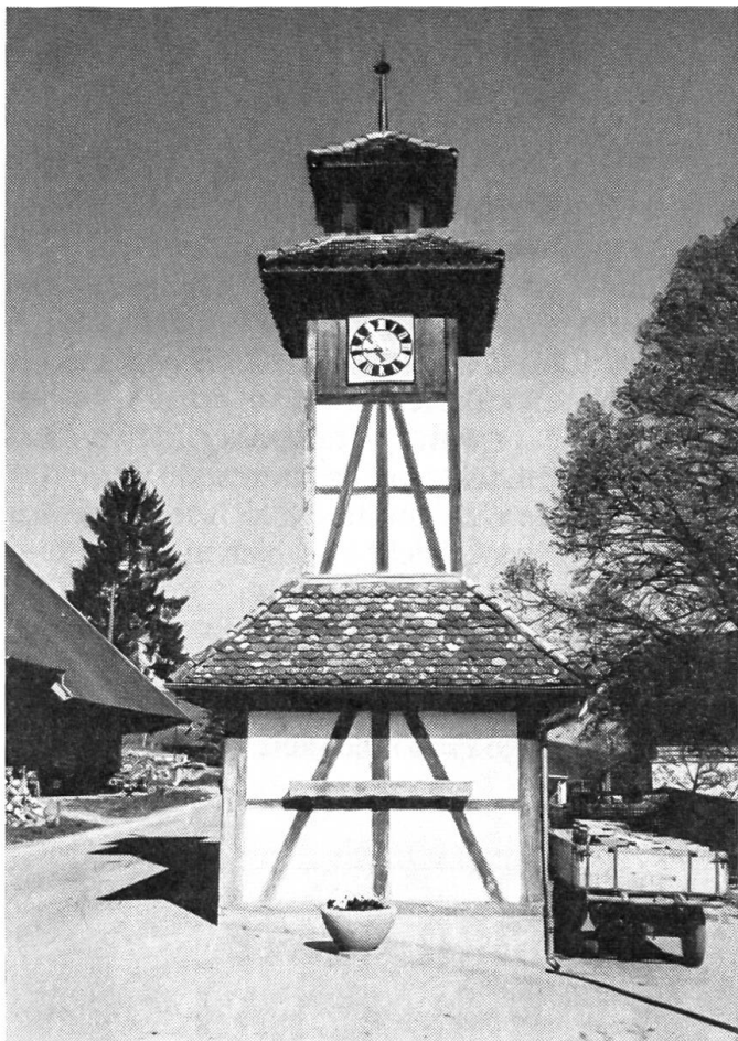
Das Wahrzeichen von Hettiswil/BE: Das «Lingezyt»

und die Obrigkeit wacht, dass mir nichts geschehe... Warte, warte!» brüllte er plötzlich. «Wohin fährst du? Wo sind wir denn? Was ist das hier vor uns?»