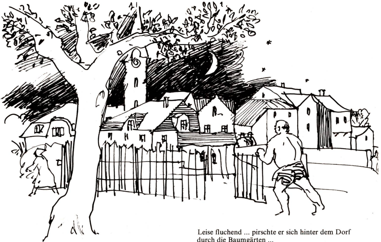
Leise fluchend ... pirschte er sich hinter dem Dorf durch die Baumgärten ...

Im Haus war es still. Er lauschte angestrengt. War sie am Ende schon zu Bett gegangen? Behutsam tastete er sich durch das finstere Treppenhause hinauf, dann durch den kurzen Gang bis zur Schlafzimmertür, wo er mit angehaltenem Atem von neuem lauschte: kein Laut. Sie ist ausgegangen, dachte er und fühlte sich wie von einem schweren Druck erlöst.