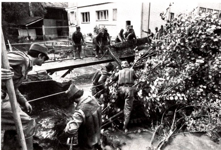
Schwere Überschwemmungen in Langenthal

«Stern» war ein wenig hinter der Mutter zu-