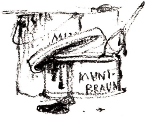
Die Geschichte vom gefärbten Muni ...

dann an des Munis weissen Bauchhaaren einwandfrei Spuren brauner Farbe festgestellt hat.