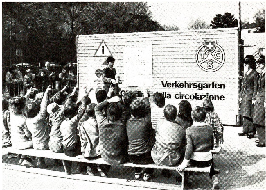
Kinder-Verkehrsgarten in Bern

Er bereitet eine Lizentiatenarbeit vor und ist zugleich als Lehrvikar an St. Nicolai in Strassburg tätig. Von 1901 bis 1902 beschäftigen ihn die Studien über das Abendmahl, das Leben Jesu und das Urchristentum. Es entstehen mehrere Schriften, darunter 1906 eine Geschichte der Leben-Jesu-Forschung. Daneben liest Schweitzer an der Theologischen Fakultät. Immer aber bleibt er ein Künstler. Er beschäftigt sich mit Bach: «Als Musiker wollte ich zu Musikern von Bachs Musik reden.» Das diesen Stoff verarbeitende Buch erschien französisch geschrieben 1905 in Leipzig. Drei Jahre später schickte er ihm eine deutsche, wesentlich erweiterte Ausgabe nach. Zu Beginn des 20. Jahrhunderts liefen Bestrebungen für eine Reform der Orgel an. Schweitzer leiht ihnen ein Ohr, und nun verbringt er manche Nächte über Orgelplänen. Er kämpft für die Erhaltung alter Orgeln, er schreibt über Orgelbau.