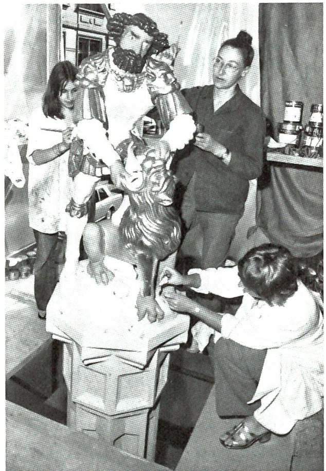
Simson-Brunnen neu bemalt