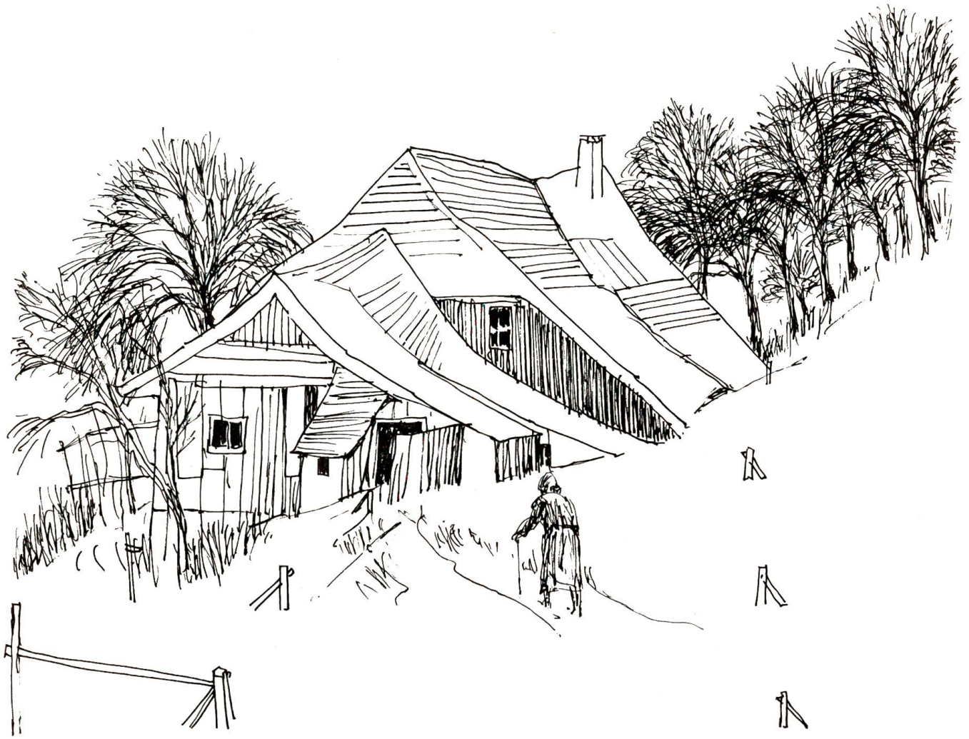
Verstört und apathisch kehrt die Mutter nach Hause zurück, wo alles schon abgesteckt ist für die neue Strasse.

gutes Dutzend schönster Obstbäume muss geopfert werden. «Sünd und schad!» jammert er vor sich hin. Bitterkeit will ihn übernehmen. Der würzige Rösslistumpen bekommt ihm mit einem Male schlecht. Er wirft ihn brennend mit aller Kraft in die Wiese hinaus.