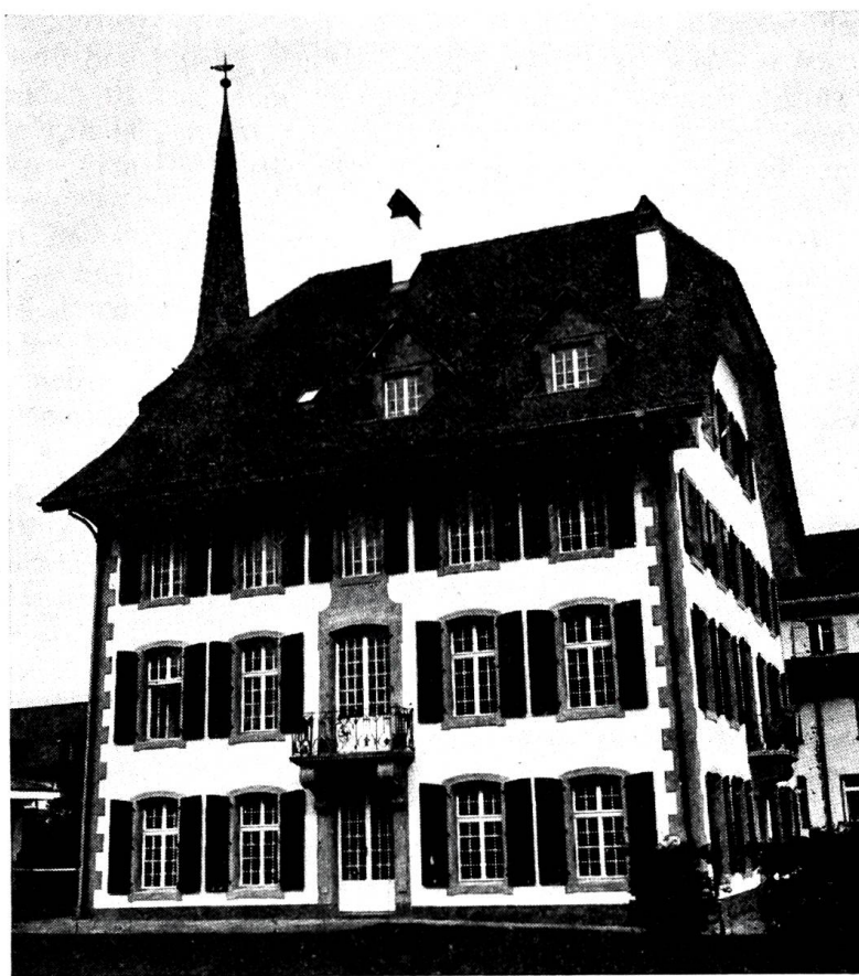
Schloss Riggisberg nach Abschluss der Renovationsarbeiten 1970