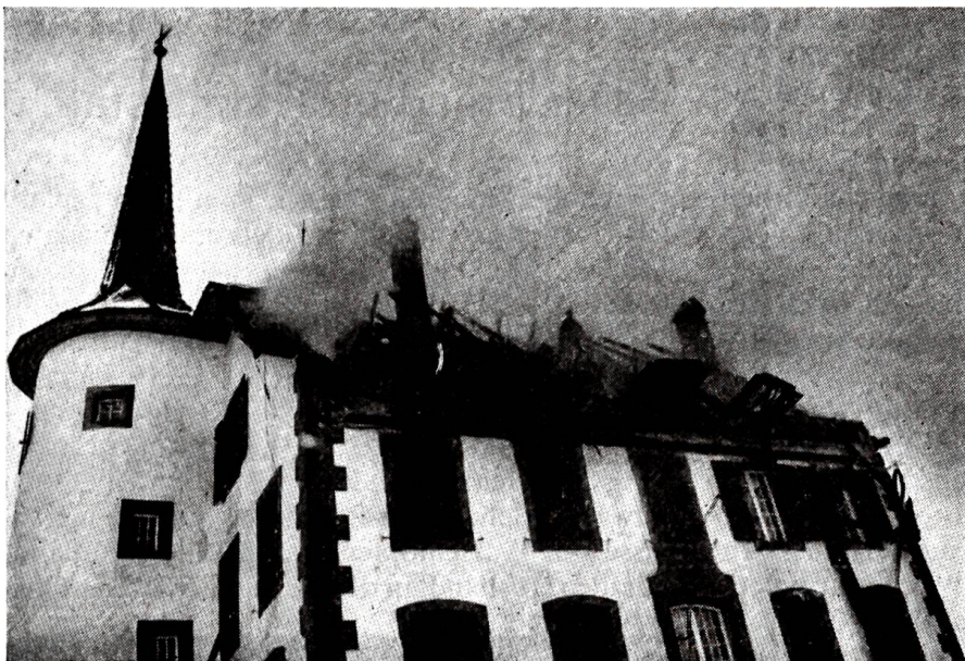
Brand in der bernischen Verpflegungsanstalt Schloss Riggisberg

Kaum war das Schloss sorgfältig renoviert, brannte im Frühjahr 1970 infolge Unvorsichtigkeit der Dachstock aus.