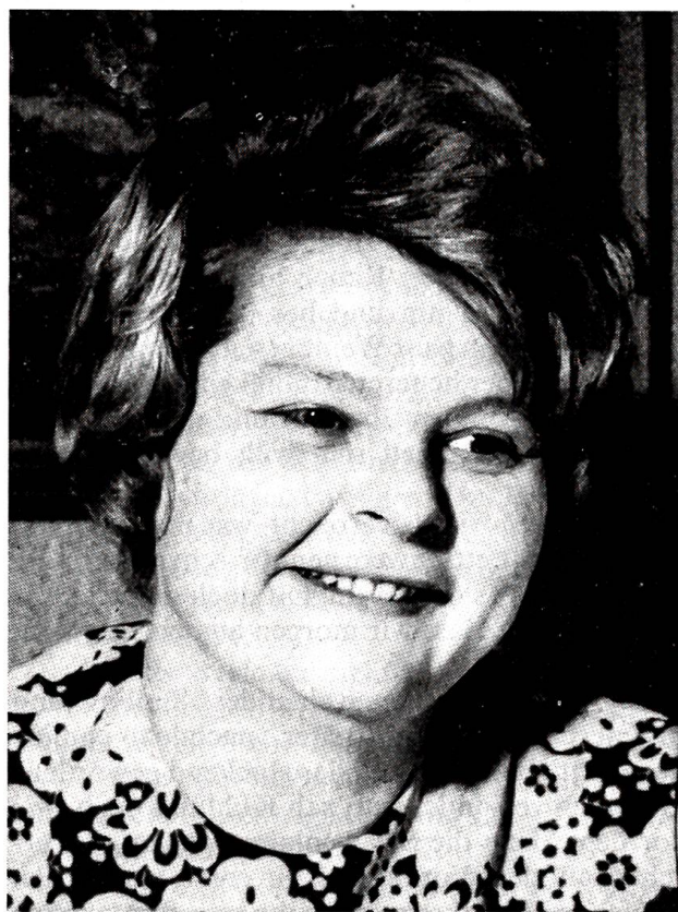
Das erste weibliche Gemeindeoberhaupt im Kanton Bern

Freunde waren dagewesen, man hatte geplaudert, Kaffee getrunken und dem hausgemachten Gebäck gehuldigt. Draussen jagten die lauen Winde des Vorfrühlings durch den Garten, ihr Brausen schwoll auf und ab, und die noch kahlen Bäume schwankten gleich ziehenden Gewichten. Es ging gegen Mitternacht, als die Gäste aufbrachen. Kohlund begleitete sie hinauf zur Strassenecke; im Heimschlendern spähte er über den schwach beleuchteten Rasen, wo die ersten Krokusse am Ausschlüpfen waren, und lief dann, plötzlich fröstelnd, in die Stube zurück. Der Ofen