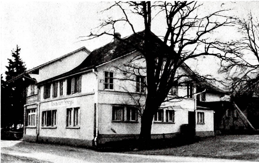
Das vielen Spaziergängern vertraute Spiegel-Pintli muss einem Neubau weichen.

sie schrittweise vordrangen, von ferne anleuchten: einen düsteren Totenhügel. Unmittelbar daneben hockte auf einer durchs Fenster geschobenen Leiter der Rohrführer, der vorher Wasser verlangt hatte.