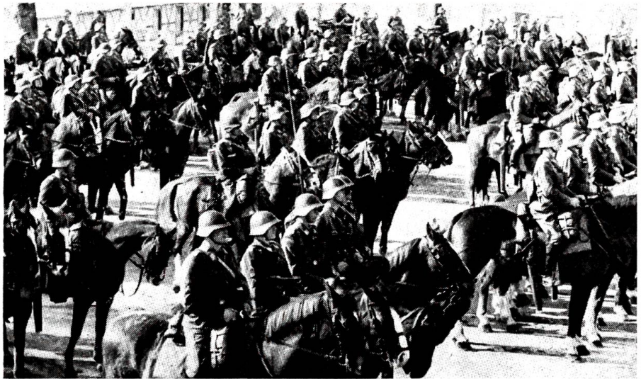
Die Dragoner wehren sich gegen die Absicht des Bundesrates, ihre Waffengattung aufzulösen. Demonstration des Dragonerregimentes I in Schwarzenburg, im März 1970.

«Nette Bescherung», rief er Kohlund entgegen, sowie er ihn im Lichtkegel seiner Taschenlampe erkannt hatte. Über einen umgestürzten Schubkarren weg reichte er ihm flüchtig die Hand und fuhr fort: «Die Hauptsache dürfte bald gelöscht sein, da ist nicht mehr viel zu helfen. Doch wirst du mit deiner Gruppe die Brandwache überneh-