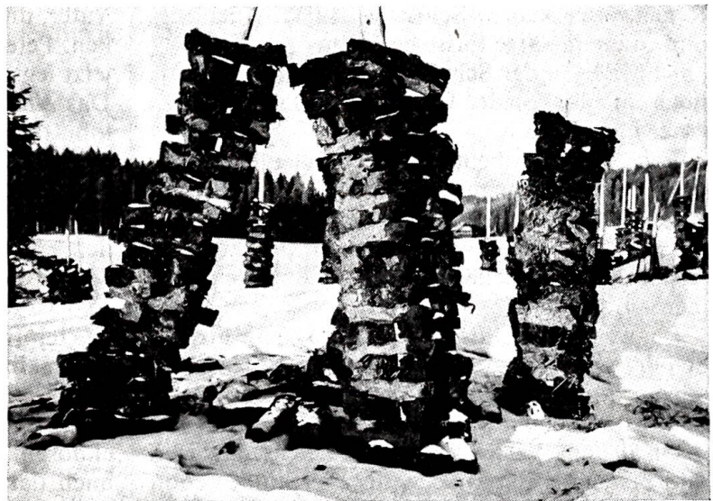
Nicht mehr gefragt

«Ich bin auch nur im Dienst einmal drüben gewesen. Und überhaupt: Ich wüsste nicht, wie ich's einrichten sollte. Auf den Letzten ist die Versicherung fällig, und du brauchst jetzt endlich ein Paar