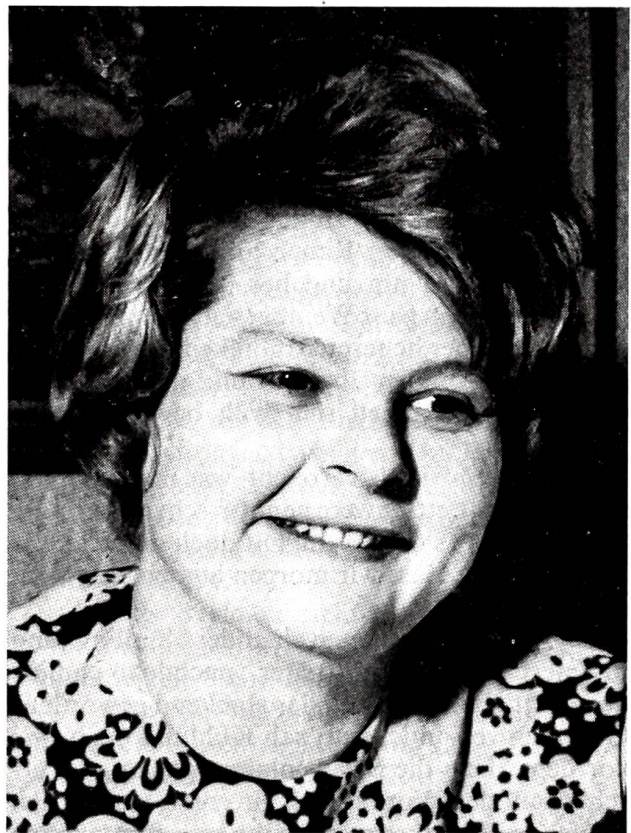
Das erste weibliche Gemeindeoberhaupt im Kanton Bern

Freunde waren dagewesen, man hatte geplaudert, Kaffee getrunken und dem hausgemachten Gebäck gehuldigt. Draussen jagten die lauen Winde des Vorfrühlings durch den Garten, ihr Brausen schwoll auf und ab, und die noch kahlen Bäume schwankten gleich ziehenden Gewichten. Es ging gegen Mitternacht, als die Gäste aufbrachen. Kohlund begleitete sie hinauf zur Strassenecke; im Heimschlendern spähte er über den schwach beleuchteten Rasen, wo die ersten Krokusse am Ausschlüpfen waren, und lief dann, plötzlich fröstelnd, in die Stube zurück. Der Ofen