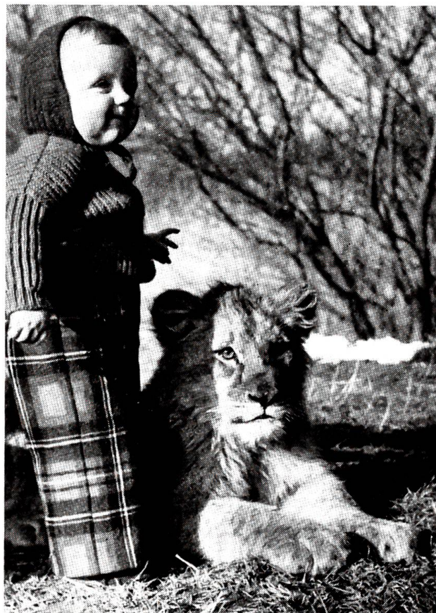
Ungewöhnliche Freundschaft

Wir sehen die Tiere im allgemeinen selten so, wie sie wirklich sind! In der Hauptsache deshalb, weil wir zu ihnen in einem freundschaftlichen Verhältnis stehen. Dies ist uns bei der höchstentwickelten Tierform, den Menschenaffen, noch am leichtesten möglich. Besonders lehrreich ist in dieser Beziehung ein Besuch des zoologischen Gartens, wo die Affen vom Publikum nur durch einen Graben oder ein Gitter getrennt sind. Das Gorillaweibchen beispielsweise versucht gar nicht, über einen vorhandenen Graben zu gelangen, da für es die einmalige Erfahrung genügt, dass die Überquerung nicht möglich ist. Der Schimpanse musste diese Erfahrung jedoch täglich immer wieder von neuem machen, trotzdem er immer wieder Beulen von misslungenen Sprüngen davontrug! Der Orang-Utan hingegen vergnügt sich stunden-