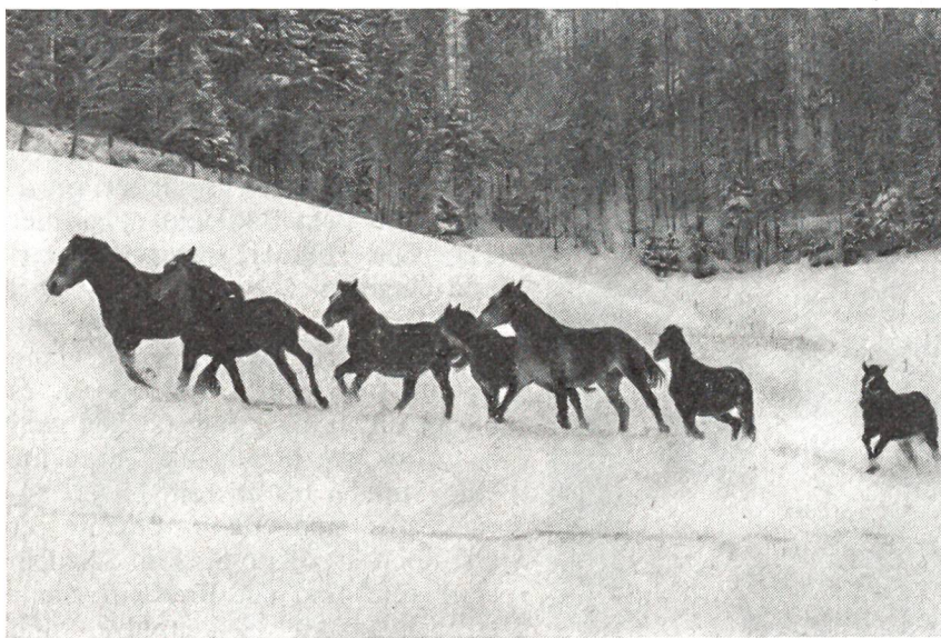
Pferde im Schnee