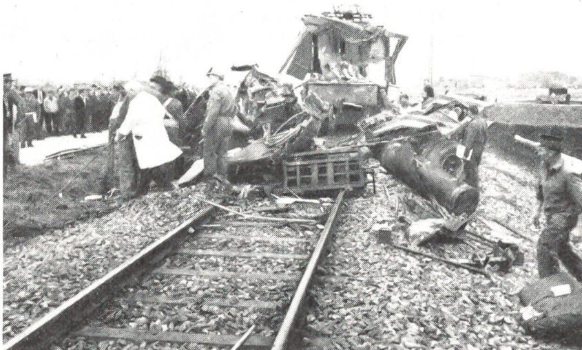
Ein Zusammenstoss auf dem Bahnübergang in Galmiz bei Murten zwischen dem Zug und einem Langholztransport forderte 5 Tote.

Glücklicherweise traf noch eine kinderreiche Familie zum Festessen ein – vielleicht begnügte sich ein kleines Kind mit einer einzigen Forelle. Man musste freilich mit einem kleinlichen Haus-