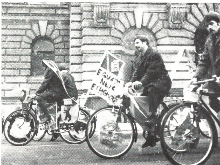
Gegen das neue ETH-Gesetz haben Studenten das Referendum ergriffen. Hier überbringen sie auf originelle Weise die 50000 Unterschriften der Bundeskanzlei.

Sicher ein guter Einfall des poetischen Hoteliers selbst, unter dem Fernrohr den schönen Spruch von Gottfried Keller anbringen zu lassen! Auch Herr Kaiser entschliesst sich, der Aufforderung des Dichters Folge zu leisten. Er hat ja genügend Kleingeld bei sich. Schon schiebt er die erste