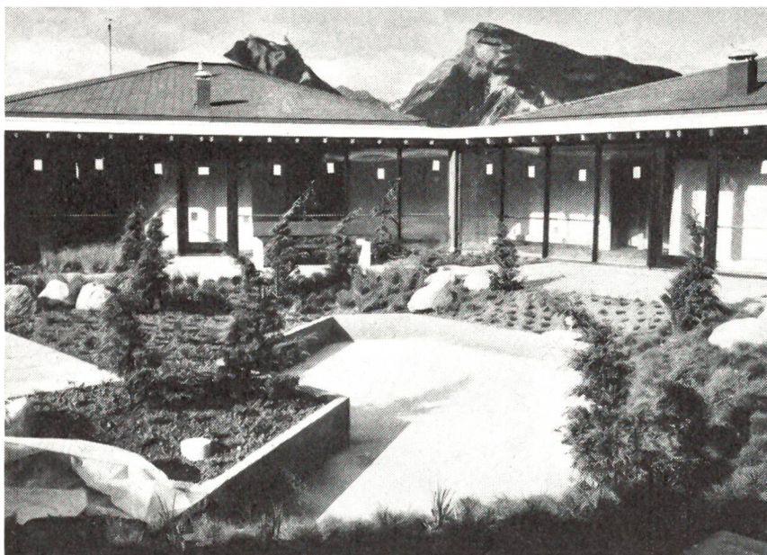
Neuer Stil im Bau von Altersheimen: das Altersheim bei Spiez.