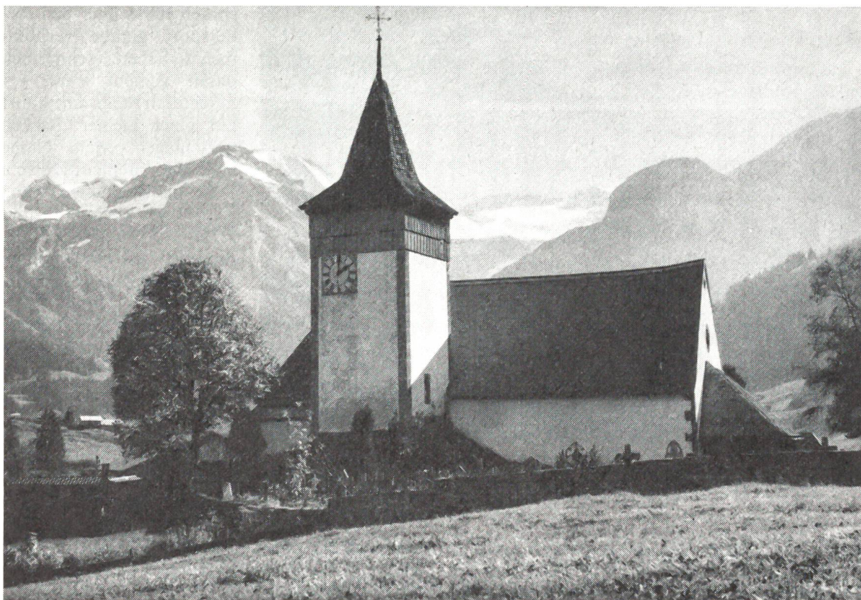
Die Kirche von Lauenen

«Du», ereifert sie sich, «wenn wir schon an einem so schönen See weilen, wäre es geradezu eine Sünde, auf den gesunden Rudersport zu verzichten. Jeden Tag eine Stunde auf dem Wasser, das wäre himmlisch. Frau Steinegger hat mir angeraten...»