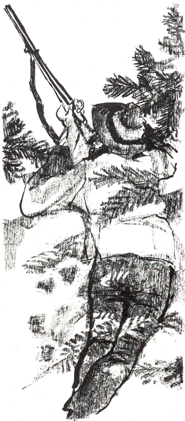
So erlegte ich ihn einst in der Morgendämmerung.