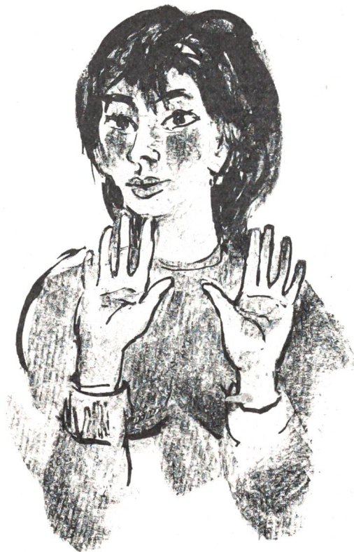
«Ich kann mich nicht fürs Leben einem Wilddieb anvertrauen!»

«Ja – und?» forschte Bergmann nach einigem Schweigen draufgängerisch. «Du hast jetzt immerhin die ganze Geschichte ordnungsgemäss gebeitet. Wenn du willst», er schmunzelte dabei schon wieder merklich, «zahlst du noch einen Beitrag in den Fond für Wildschadenvergütung. Und wenn wieder einmal ein Zehn- oder Zwölfender, vielleicht auch nur eine Kuh, aus dem Fänggital herüberwechseln sollte, bleibst du hübsch ruhig. Es gibt ja heutzutage nicht mehr so magere Winter.» Lachend klopfte er seine er-