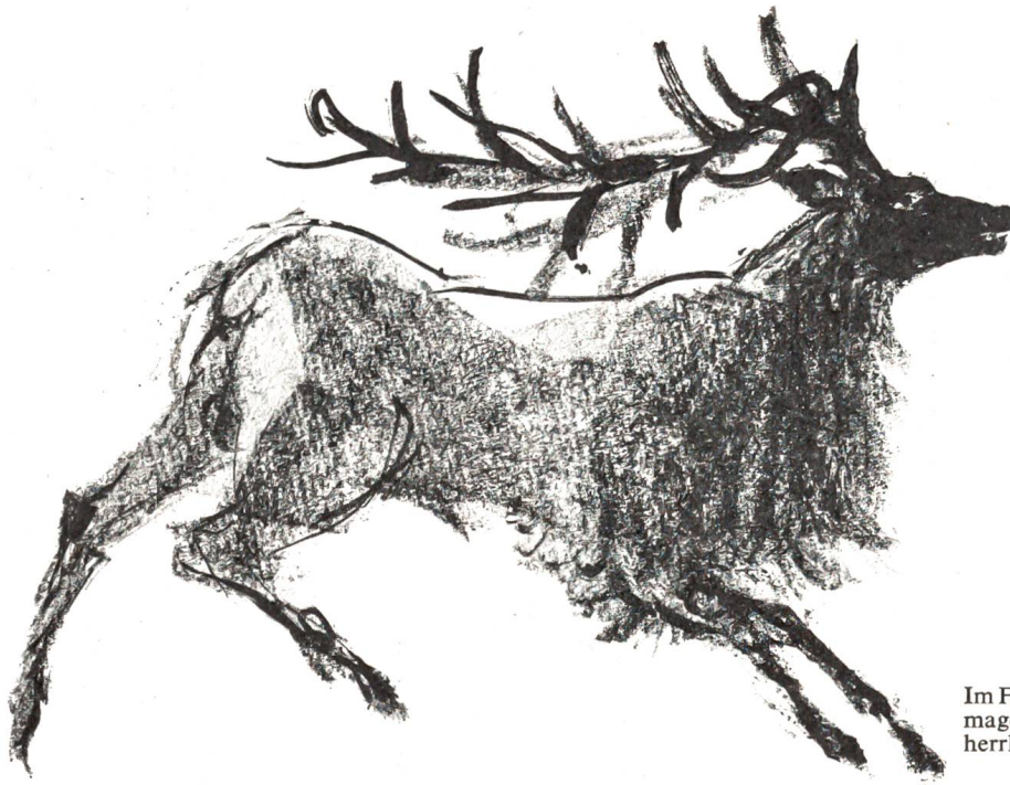
Im Frühsommer war er noch ziemlich mager. Aber bis im August wurde er herrlich feist.

Anderhalden langte seinen Tabaksbeutel hervor und stopfte von neuem. Wahrscheinlich liess sich die Beichte unter Dampf besser bewerkstelligen. Während des Anzündens sprach er in die Flamme: «Der Hirsch muss damals von weit ennet den Bergen zu uns herübergewechselt sein. Hier im Tal gab's meines Erinnerns nie welche...»