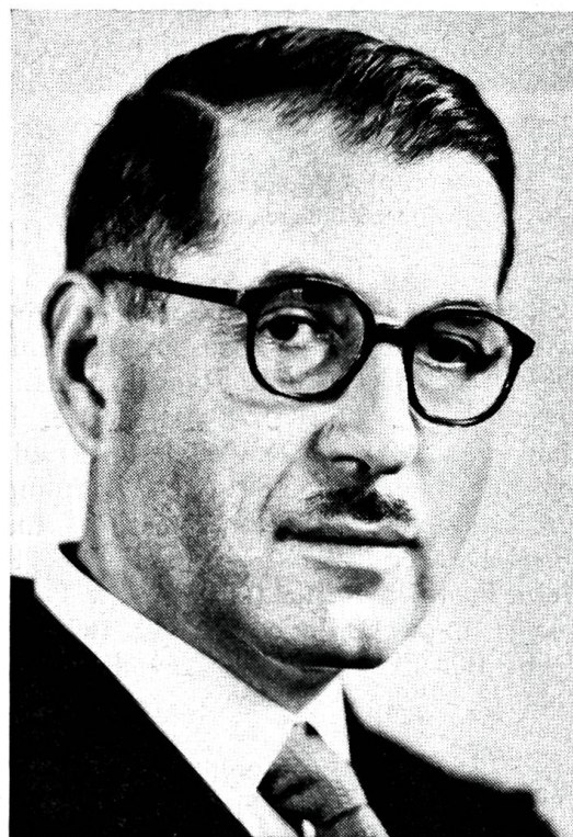
Dr. Karl Kobelt alt Bundesrat, Bern † 5. Januar 1968