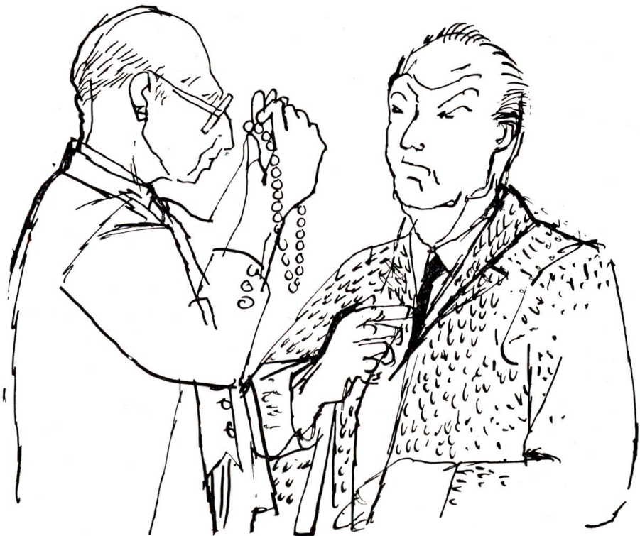
Er hob ein paar der Perlen nahe vor seine stark bombierten Augengläser, ...

Während Boller diese Worte heraushaspelte und vor Aufregung schwitzte, betrachtete der Juwelier die Kette mit kühlem Kennerblick. Er hob ein paar der Perlen nahe vor seine stark bombierten Augengläser, andere betastete er nur und machte dazu ein Gesicht wie ein Musiker, der sein Instrument stimmt. Schliesslich biss er