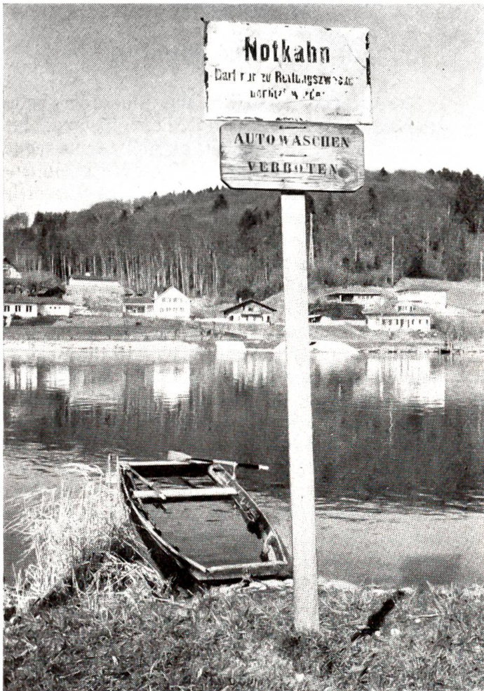
Wer wagt wohl, diesen Notkahn zu Rettungszwecken zu benutzen?