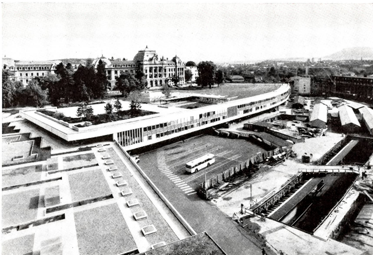
Der Bahnhofneubau in Bern: Unser Bild zeigt eine Gesamtübersicht über die neue Parkanlage vor der Universität.