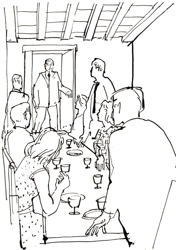
Mehr als einen, der sich vor Furcht und Schrecken gefeit glaubte, überließ die Gänsehaut

„Ach, ich habe schon so viele vergebliche Schritte unternommen. Mit meinem französischen Ausweis reiste ich bereits vor Jahren legitim in die Schweiz ein. In Noirmont und dort herum fahndete ich nach dem Mann, dem ich seinerzeit mein Fahrrad und meine Schriften verkauft habe.