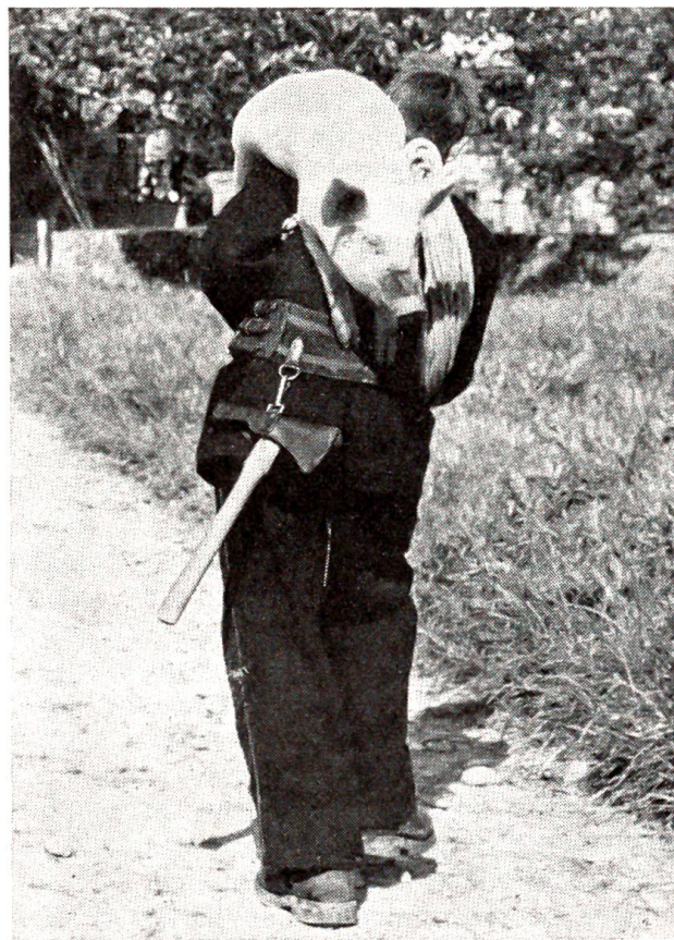
Auch den Umgang mit Tieren muß ein Feuerwehrmann beherrschen

Unsere drei Hauptabschnitte „Das Bernbiet ehemals und heute“, die „Gedenktafel“ und die „Welt-