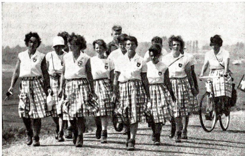
Viertagemarsch in Nijmegen. Hier eine fröhliche Gruppe von Schweizer Teilnehmerinnen.