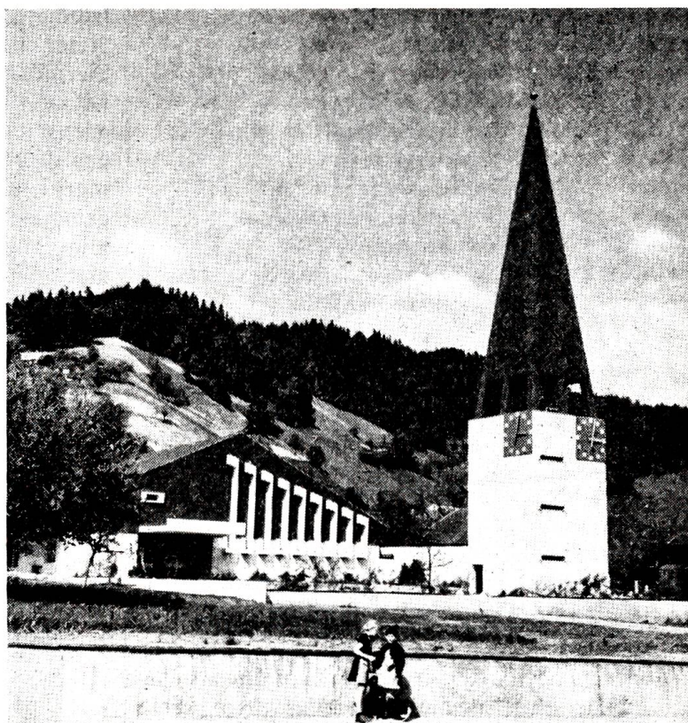
Die neue Kirche von Zäziwil, die im Frühjahr 1964 eingeweiht werden konnte. Das von Architekt Werner Ruenzi in Bern erbaute Gotteshaus zeigt augenfällig, daß sich gute moderne Architektur ausgezeichnet mit der Landschaft zu verbinden weiß.

„Gratuliere, Herr Häusler! Das müssen wir in Ruhe miteinander besprechen. Ich werde Ihnen