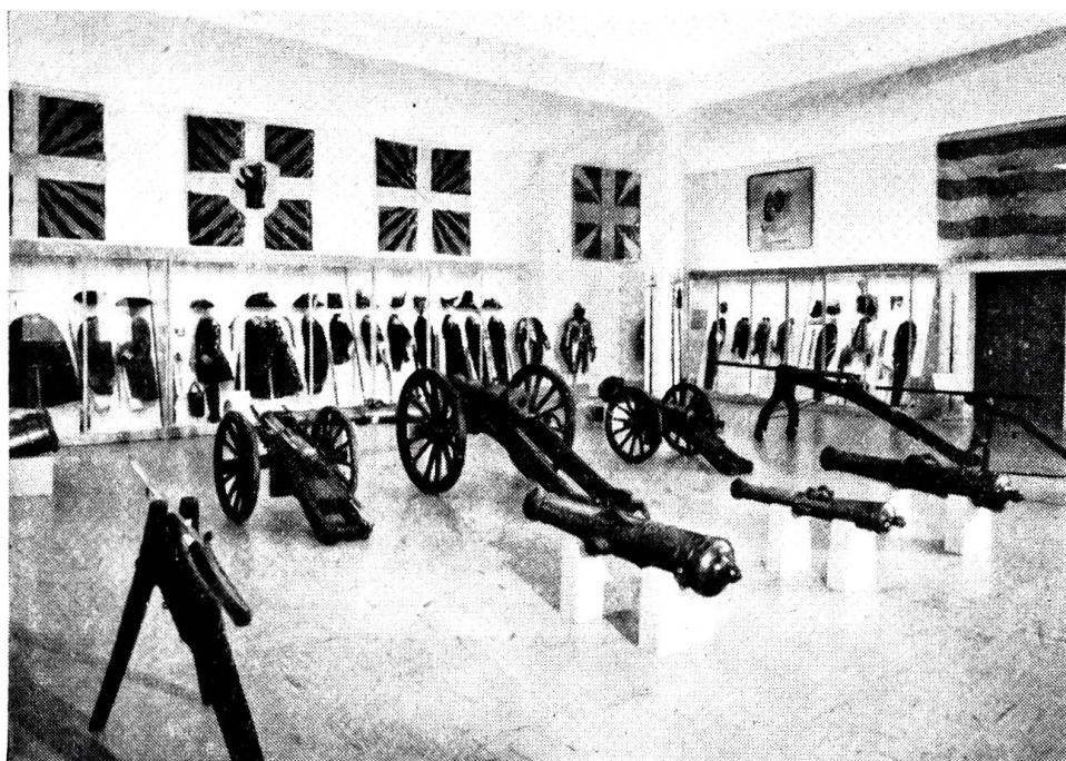
Im Frühjahr 1962 wurde im Historischen Museum in Bern die neu eingerichtete und umgebaute Waffenhalle den Besuchern geöffnet.