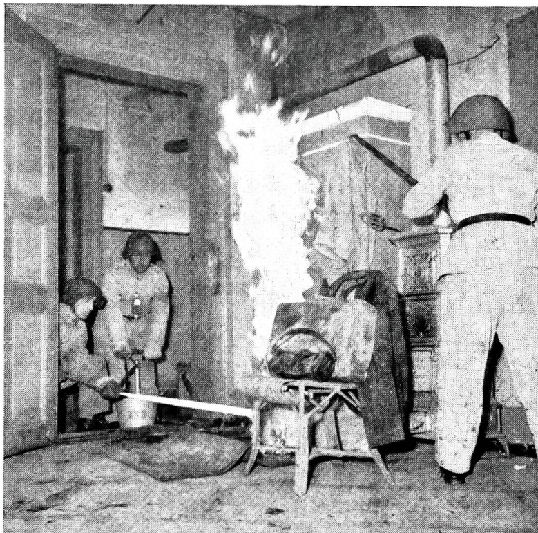
Mit dem neuen Zivilschutzgesetz hat die Ausbildung des Zivilschutzes ihre Grundlage gefunden. Hier ein Bild aus einem Ausbildungskurs für Gebäudechefs.

Als ich mich jetzt wiederum neugierig nach unserer „Autostopperin“ umsehe, ist alles freudige