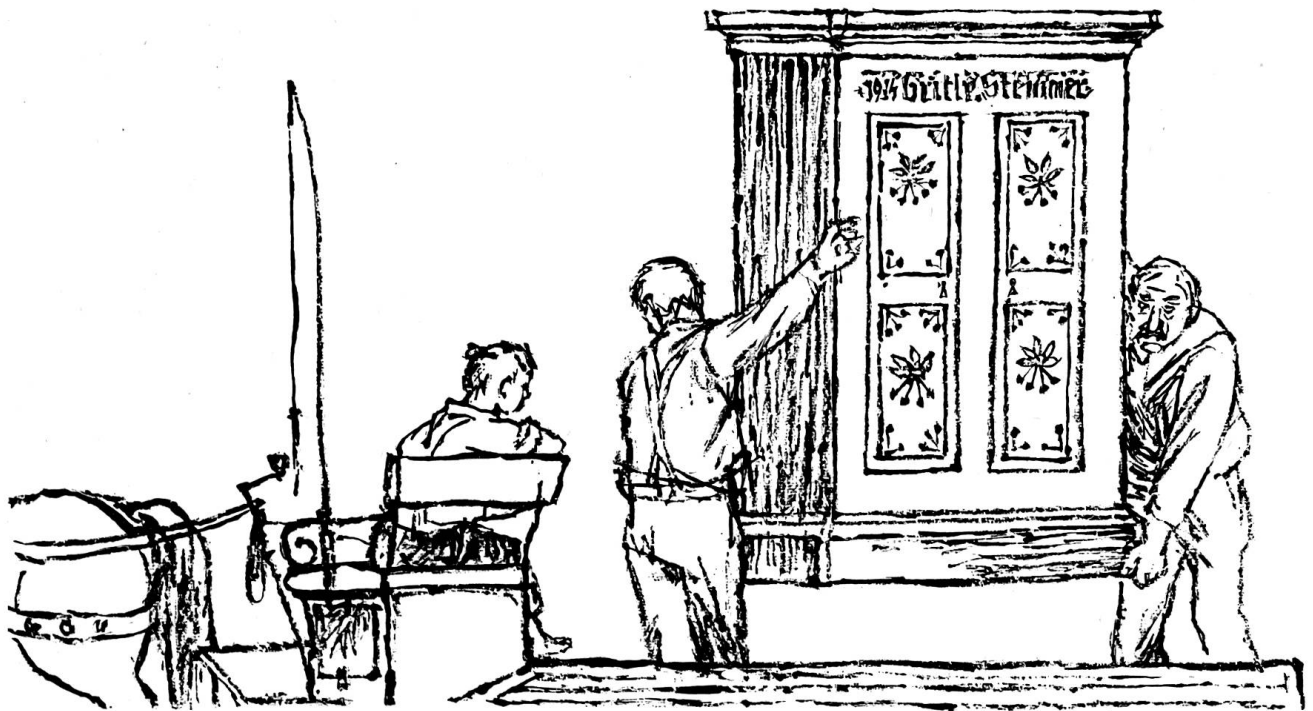
... stand ein kirschbaumener Doppelfasten auf ihrem Aussteuerwagen.