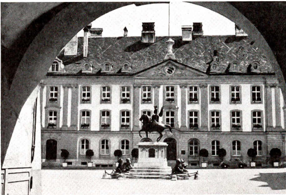
Rudolf von Erlach am alten Standort auf dem Münsterplatz. Im Hintergrund das Stiftsgebäude.

Der Engel neigte sich über das Bettchen, und mit von Tränen verschleierter Stimme begann er zu summen: