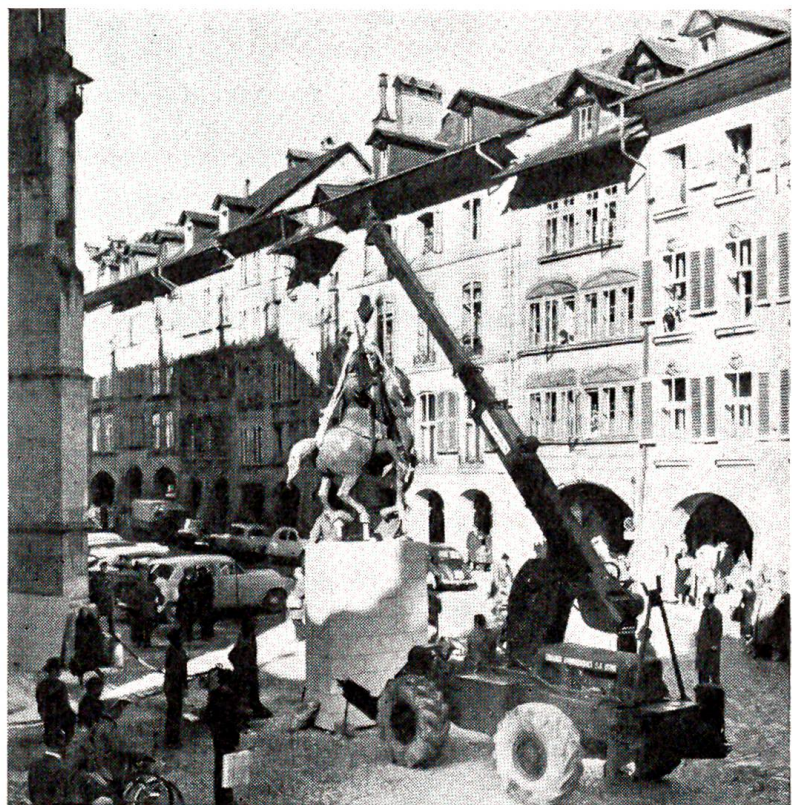
Gesucht: Ein neuer Standort für Rudolf von Erlach. Das Denkmal des Siegers von Laupen wird hier provisorisch an der Kirchgasse unterhalb des Münsters postiert. Der Entscheid über den definitiven neuen Standort ist noch nicht gefallen.