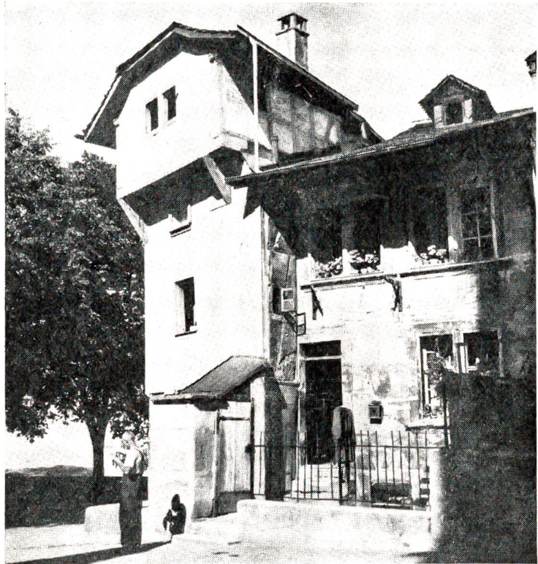
Wieder muß ein romantischer Winkel im Andegghöfli in Bern der Altstadt-sanierung weichen.

„Heiliger St. Bureaukrati, ich bin weder gekommen, dir tonnenweise Aktenstaub abzukaufen noch die Schaffung neuer Schikanen zu beantragen, ebensowenig habe ich Vorschläge für einen noch geschräubteren Amtsstil; das müßte ich Berufeneren überlassen. Im Gegenteil, ich stehe da gewissermaßen als Abgesandter der Vernunft, des gesunden Menschenverstandes, um dich zur Abdanke zu überreden. Du hast schweres Unheil angerichtet in der Welt, du machst deine Beamten konfus und das Publikum verrückt, du schaffst Elefanten aus Mücken und aus klaren Gedanken sophistische Labyrinth. Einfache Briefbogen verwandelst du in Aktenstöße, du denkst in Rautschuf und handelst als Polyp; wo du trittst, da wachsen kein Denken und keine Initiative mehr. Lieber Bureaukrati, du machst die Welt zum Irrenhaus, so daß sie sich deiner nicht mehr erwehren kann; sie wird allmählich abgestumpft, unfähig, all deinen Unsinn kritisch zu beurteilen. Du bietest tausend Angriffsflächen und bist doch unverwundbar, man schimpft über dich und findet sich doch willenlos mit dir ab. Du eignest dich als Stehaufmännchen an einem Jahrmarkt, oder als Beherrscher der Amtsstuben hast du abgewirtschaftet. Ich flehe dich dringend an: hör auf mit deiner Tyrannei, verflüchtige dich, schließe deine Bude und entlasse all deine Halb- und Dreivierteltötter, auf daß alle Obrigkeit wieder Mensch werde!“