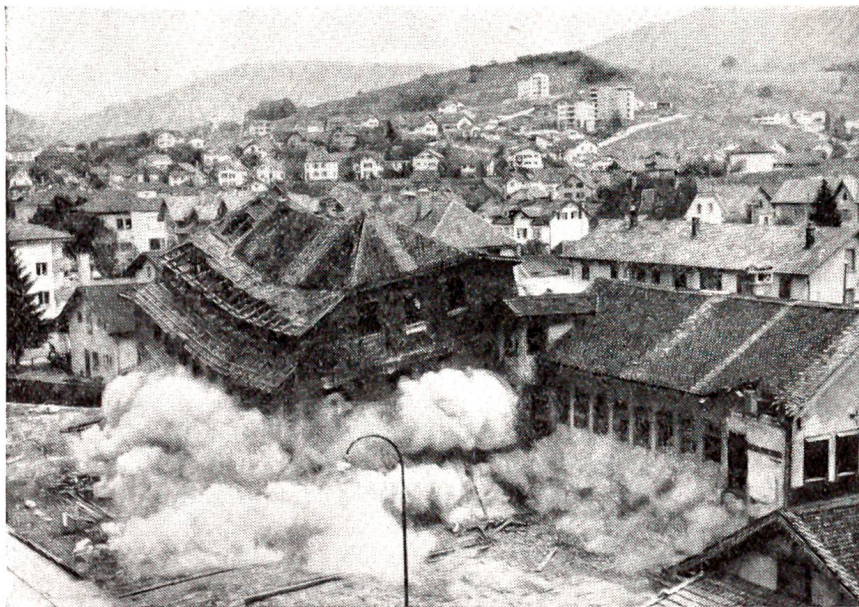
Ein eindrückliches Bild von der Sprengung der ältesten Uhrenfabrik im Berner Jura. Die 1851 erbaute Fabrik in Münster muß einem neuen Verwaltungsgebäude Platz machen. Sekunden nach dieser Aufnahme existierte vom ganzen Komplex nur noch ein Trümmerhaufen.

Indessen hatte ich die Rechnung ohne meinen Heiligen, das heißt, ohne seine dritte Vorinstanz, gemacht. Vier Monate nachher erreichte mich ein Einschreibebrief, worin mir besagte Vorinstanz meine Schindluderei aufs heftigste verbat. Die Ironie sei durchaus unangebracht. Man hätte mir je ein Komma und einen i-Punkt verlangt und nicht deren drei. Mein Vor-