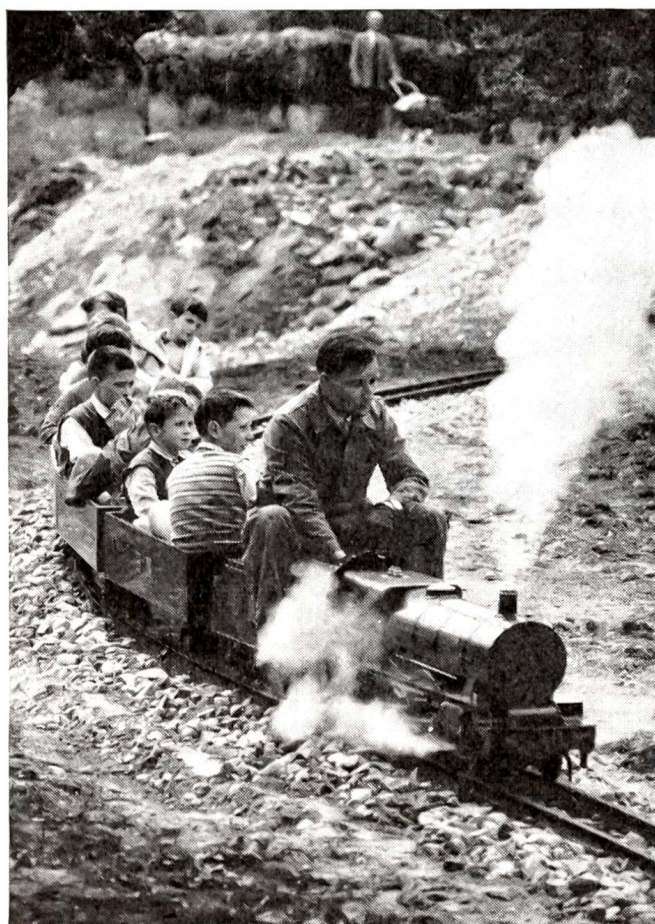
Eine neue Attraktion