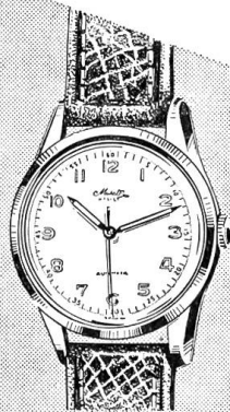
1540 (Herren) AUTOMATIC wasserdicht «zieht sich selbst auf» Chrom-Stahlboden Fr. 97.- Goldplaque, 20 Mikr. Fr. 112.- Ganzstahl Fr. 110.-