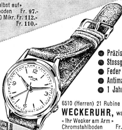
5510 (Herren) 21 Rubine WECKERUHR , wasserdicht «Ihr Wecker am Arm» Chromstahlboden Fr. 110.- Goldplaque 20 Mikr. Fr. 124.- Ganzstahl Fr. 120.-