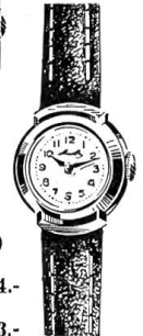
6711 (Damen) Chromstahl- boden Fr. 54.- Goldplaque 20 Mikr. Fr. 63.- 18 K. Gold 165.-