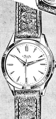
7613 (Herren) Wasserdicht Chromstahlboden Fr. 69.- Goldplaque 20 Mikr. Fr. 82.- 18 Karat Gold Fr. 285.-