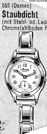
555 (Damen) Staubdicht (mit Stahl-od. Lederband) Chromstahlboden Fr. 53.-