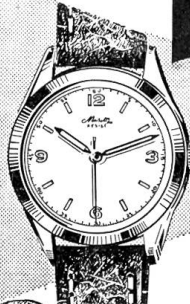
6513 (Herren) Wasserdicht Chromstahlboden Fr. 64.- Ganzstahl Fr. 76.-

11 Schlager-Modelle mit 5 Musette-Vorteilen