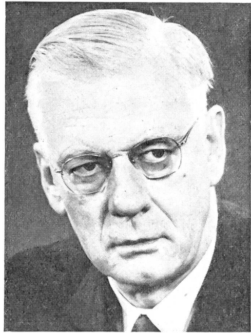
Bundesrat Dr. Markus Feldmann, Bern