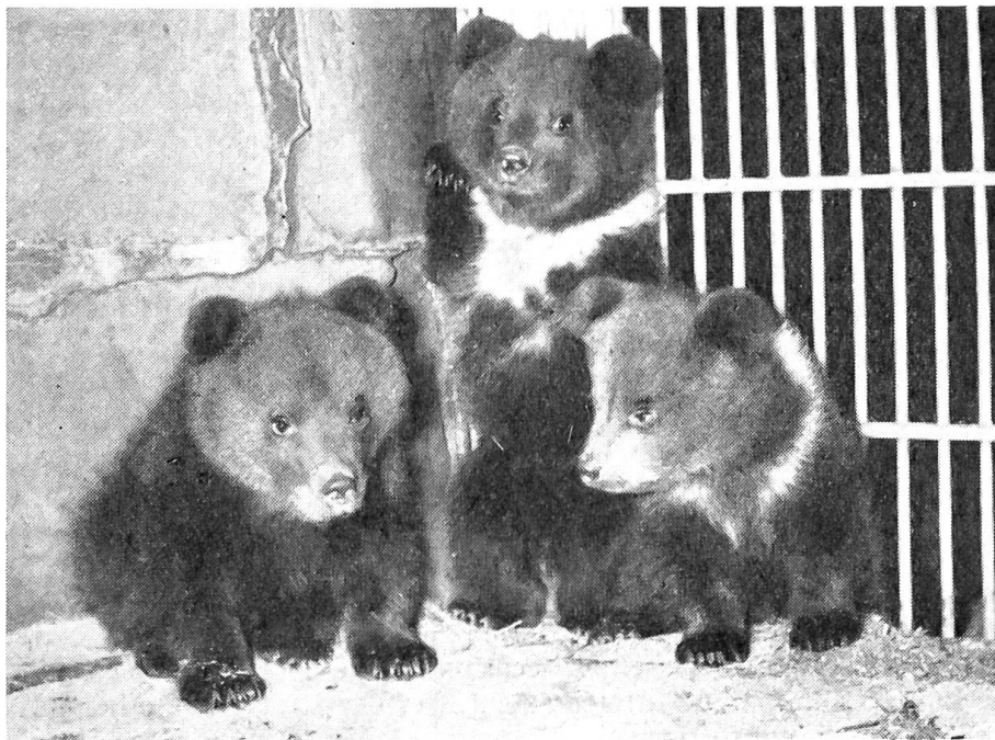
Am 21. April 1959 erhielten die drei Jungen der Bärin Ursula zum erstenmal Ausgang.

La Trémouille als Siegestrophäe heimgebracht hat. Das Wappentier wurde in einem eigens hiefür vor dem Räfigturm aufgeworfenen Graben untergebracht. Dieser wurde 1764 nach der Stadtseite des innern Golattenmattgäßtores (heute Narbergergasse) verlegt, und als 1825 – von Mans vereinsamer Bär hatte inzwischen wohl schon längst einen Gespanen erhalten – den beiden Bären beim Narbergertor eine neue Behausung angewiesen wurde, da wog das Männchen 530, das Weibchen 480 Pfund. 1571 und 1603 gelang es den Mützen, auszubrechen, einen Bummel durch die Stadt zu machen und die Berner zu erschrecken, sie fügten aber niemandem Schaden zu und konnten wieder eingefangen werden. 1575, also hundert Jahre nach der angeblichen Stiftung Herzog Renatus' soll die Bärin zwei schneeweiße Junge – sogenannte Albinos – bekommen haben. Solche weiße Bären wurden damals als böses Omen angesehen, aber in der langen Geschichte des Bärengrabens sind mehrmals solche abnorme Geburten vorgekommen. Als 1798 die Franzosen einzogen, bemächtigte sich General Brune der schönsten drei Mützen und