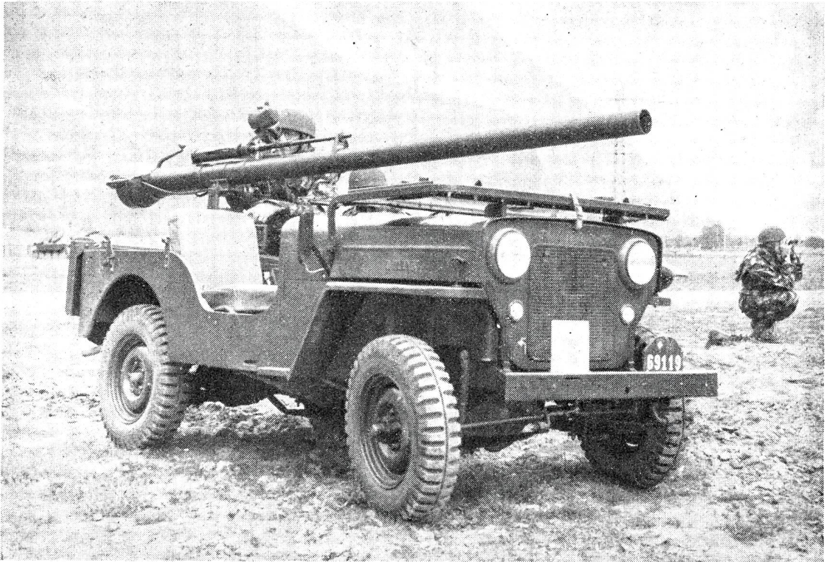
Die 10,6 cm rückstoßfreie amerikanische Panzerabwehrkanone „BAT“, deren Einführung für die Schweizer Armee geprüft wird.