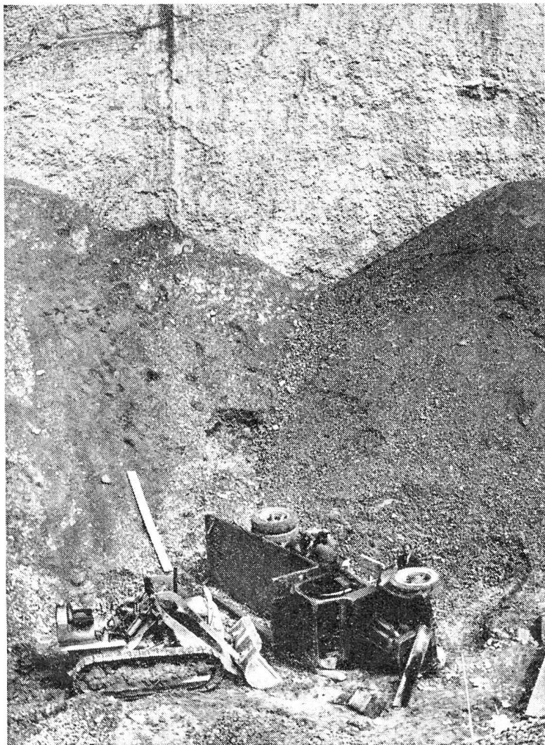
Glück im Unglück hatte der Chauffeur dieses Lastwagens, der bei einem Rippmanöver am oberen Rand einer Riesgrube plötzlich bemerkte, daß er seinen Wagen nicht mehr bremsen konnte. Es gelang ihm, hinauszuspringen, bevor der Lastwagen fast 50 m tief in die Riesgrube abstürzte.