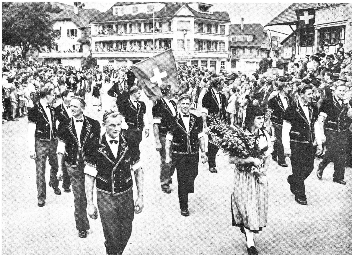
Kantonal-bernisches Zodlerfest in Ronolfingen

Die Figur des Post und Nachrichten bringenden, umherziehenden Stelzfußes ist legendär und soll aus dem nördlichen Deutschland des 17. Jahr- hunderts stammen. Es handelte sich dabei wohl