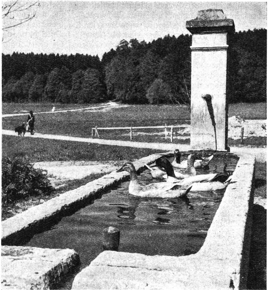
Die klugen Enten

Bennys Onkel versuchte einen Seufzer zu unterdrücken. Das hatte ihm jetzt, da er im Begriffe war, sich auf seine ernste Arbeit zu konzentrieren, gerade noch gefehlt. Aber es blieb ihm keine Wahl: schon klapperten dünne Absätze unternehmungslustig durchs Treppenhaus und wenig später rauschte der angemeldete Besuch ins Zimmer. Bennys Onkel waren während der vielen Jahre, da er seinen Beruf ausübte, alle möglichen Menschen unter die Augen gekommen. Nicht immer waren seine Patienten so beschaffen gewesen, wie er es sich gewünscht hatte, aber seine angeborene