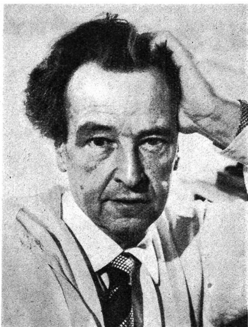
Arthur Honegger, Komponist, Paris