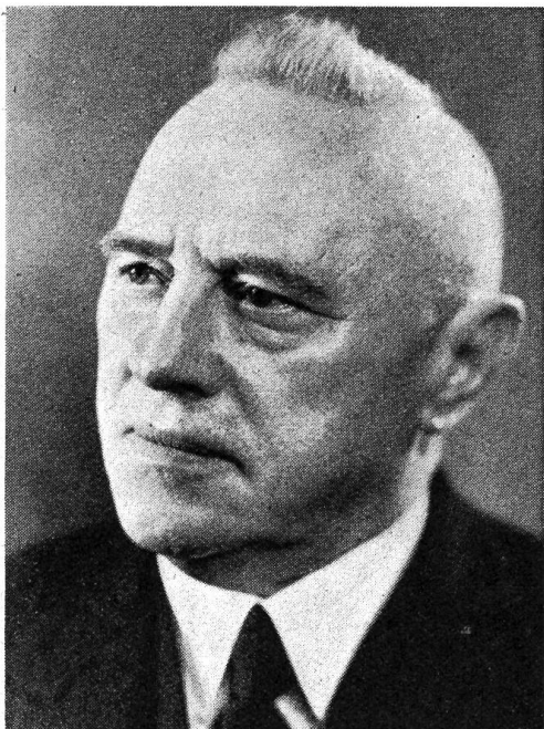
Alt Bundesrat Dr. h. c. Rudolf Minger, Schüpfen