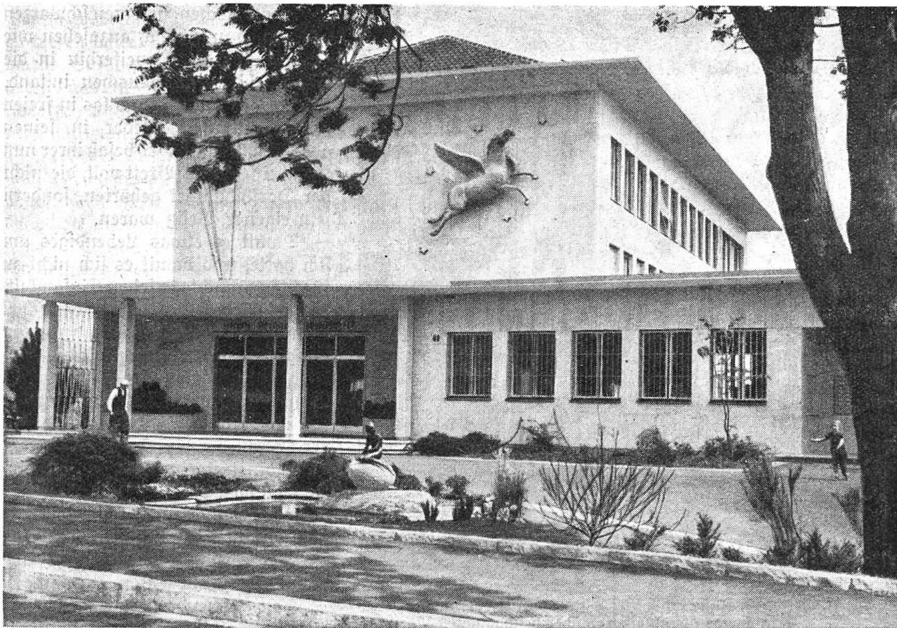
Im Sommer 1953 wurde der Neubau des Weltpostvereins in Bern eingeweiht.