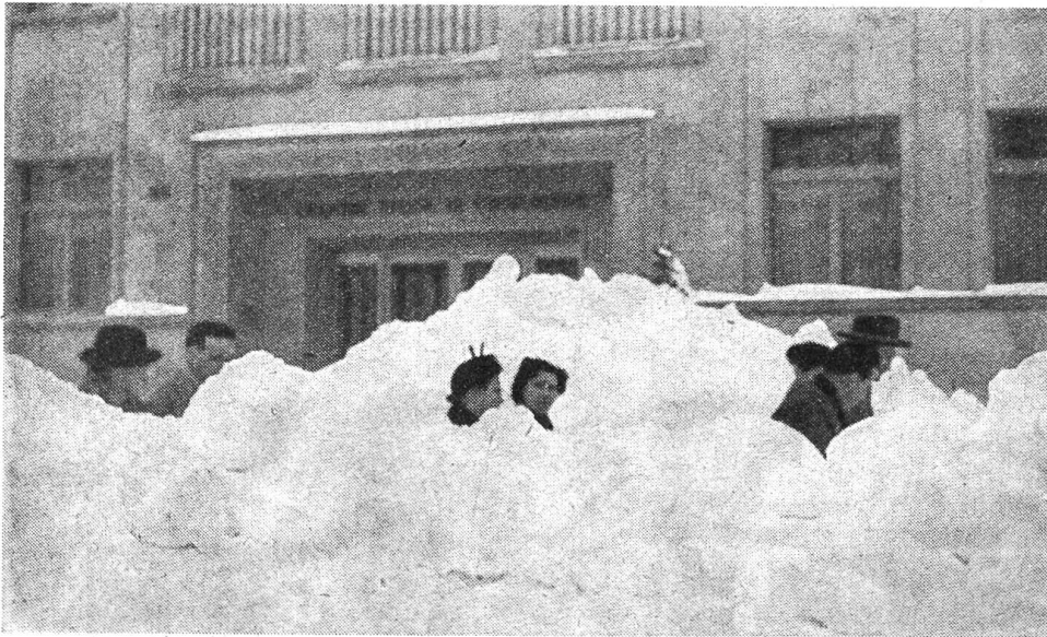
Im Februar 1953 fiel im ganzen Jura außerordentlich viel Schnee.

Es gab da auf dem Büro in der Fabrik einen