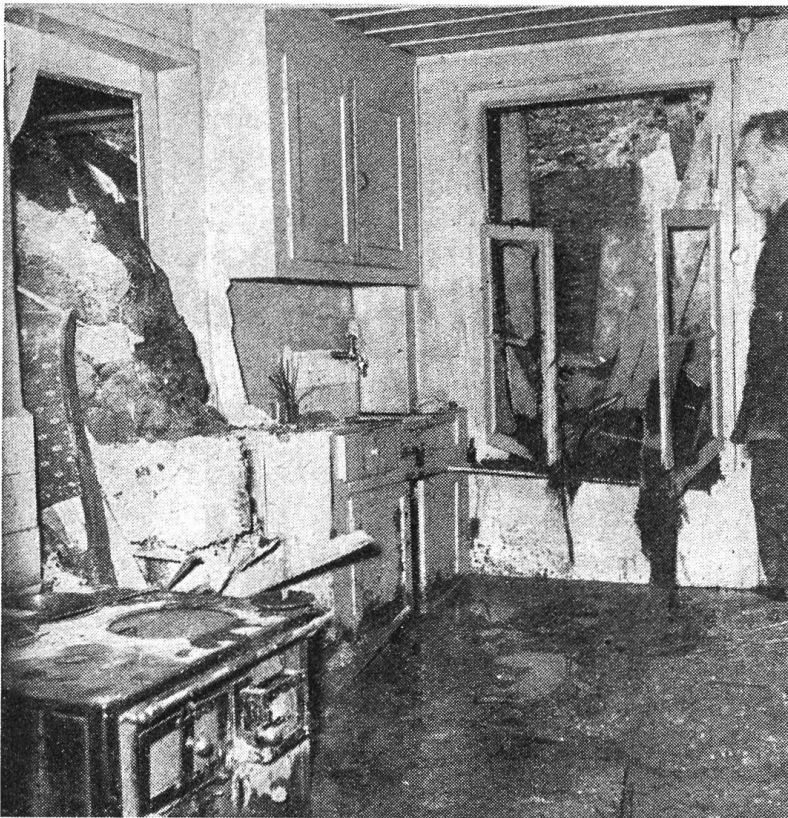
Die Unwetter im Juni 1953. Bei Bärau wurde ein Haus von abruttschenden Erdmassen schwer beschädigt.