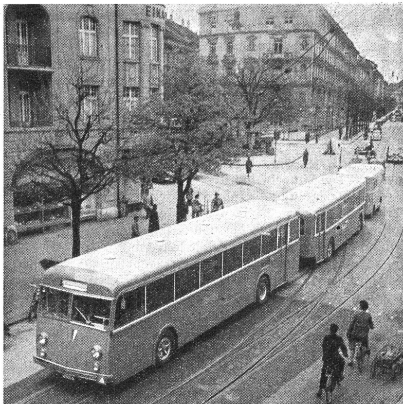
Ersatz der Straßenbahn durch Autobusse

Es zeigte sich dann bald, daß sein Name zu ihm paßte. Er brachte Munterkeit in das stille kleine