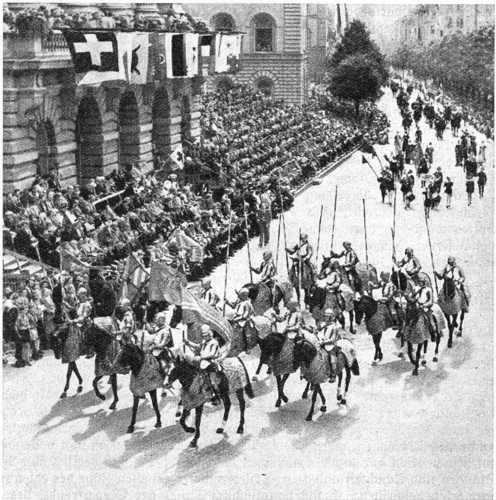
Bern 600 Jahre im Ewigen Bund der Eidgenossen Aus dem Festzug: Die Gardereiterei Karls des Kühnen von Burgund