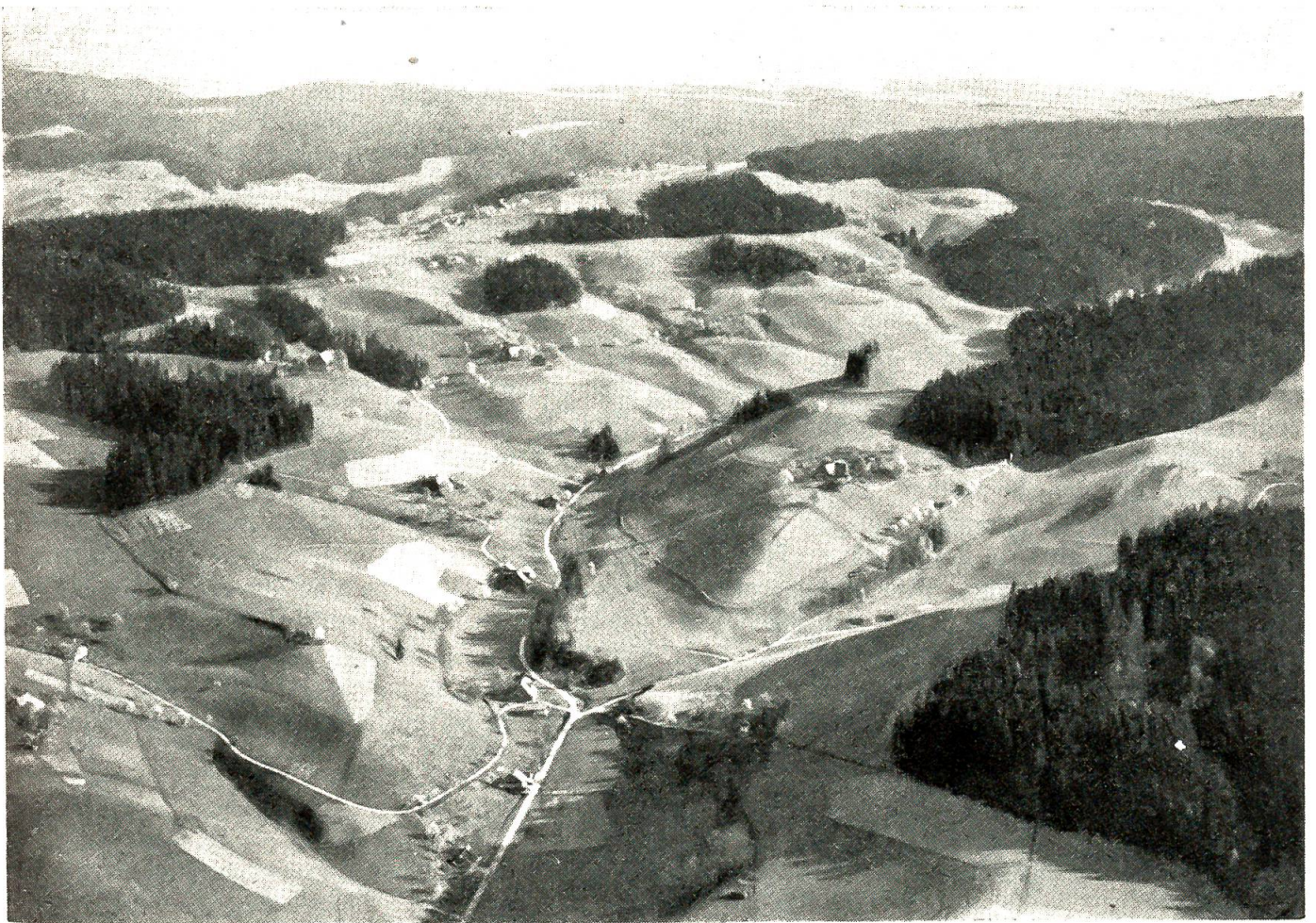
Fliegeransicht der Emmentallandschaft

Hand durchstreiften die jungen Feudalherren die unwegsamen Waldungen auf dem rechten Ufer der Emme, entfalteten fern allen Stadtdienstes ihr triebstarkes, ungebundenes Wesen und hüteten eifrig die Rechte in den umliegenden Weilern, in Aeschau, Horben, Neuenschwand, Niedmatten, Dieboldsbach und Dieboldswil. Im 13. Jahrhundert besaß ein Zweig der Familie die Talwarte Attinghausen in Uri, ein anderer setzte sich auf Wartenstein fest, einer Wehrbaute, die vom schmalen Grat des Ralchmattberges den mittleren Abschnitt des Emmentals beherrschte. Gegen Ende des 14. Jahrhunderts gaben die Schweinsberg ihre Rechte in der Gegend von Eggiwil auf, und an ihre Stelle traten die mit ihnen verwandten