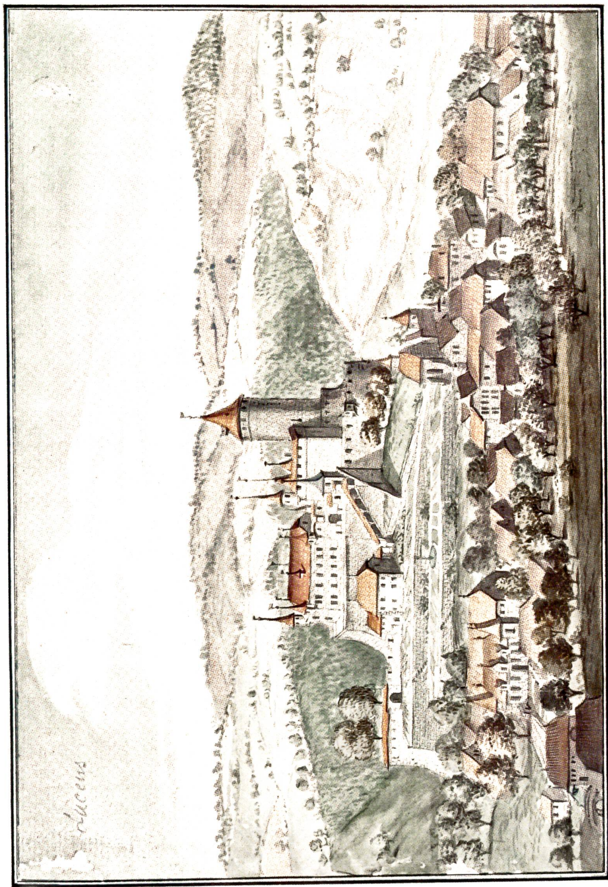
Schloß Lucens im Waadtland

Aquarell eines unbekannten Meisters, wahrscheinlich aus dem 17. Jahrhundert Original im Besitz des Berner Historischen Museums (Sammlung Kautz)