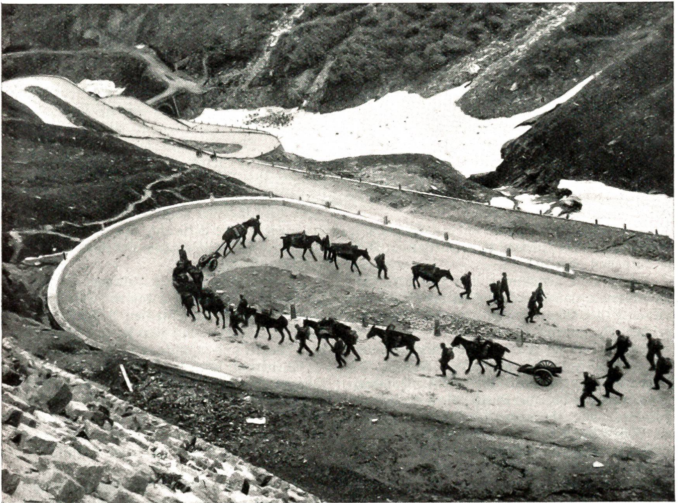
Gebirgsartillerie auf dem Gotthardpaß

Begegnete Frau Habegger der Nachbarin, versuchte sie ein Gespräch in alter Herzlichkeit. Man mühte sich beidseitig, den alten Ton zu finden — und fand ihn nicht. Hüben und drüben litten die Frauen unter den gestörten Verhältnissen. Dampf verstrichen die Tage. Die Wege blieben