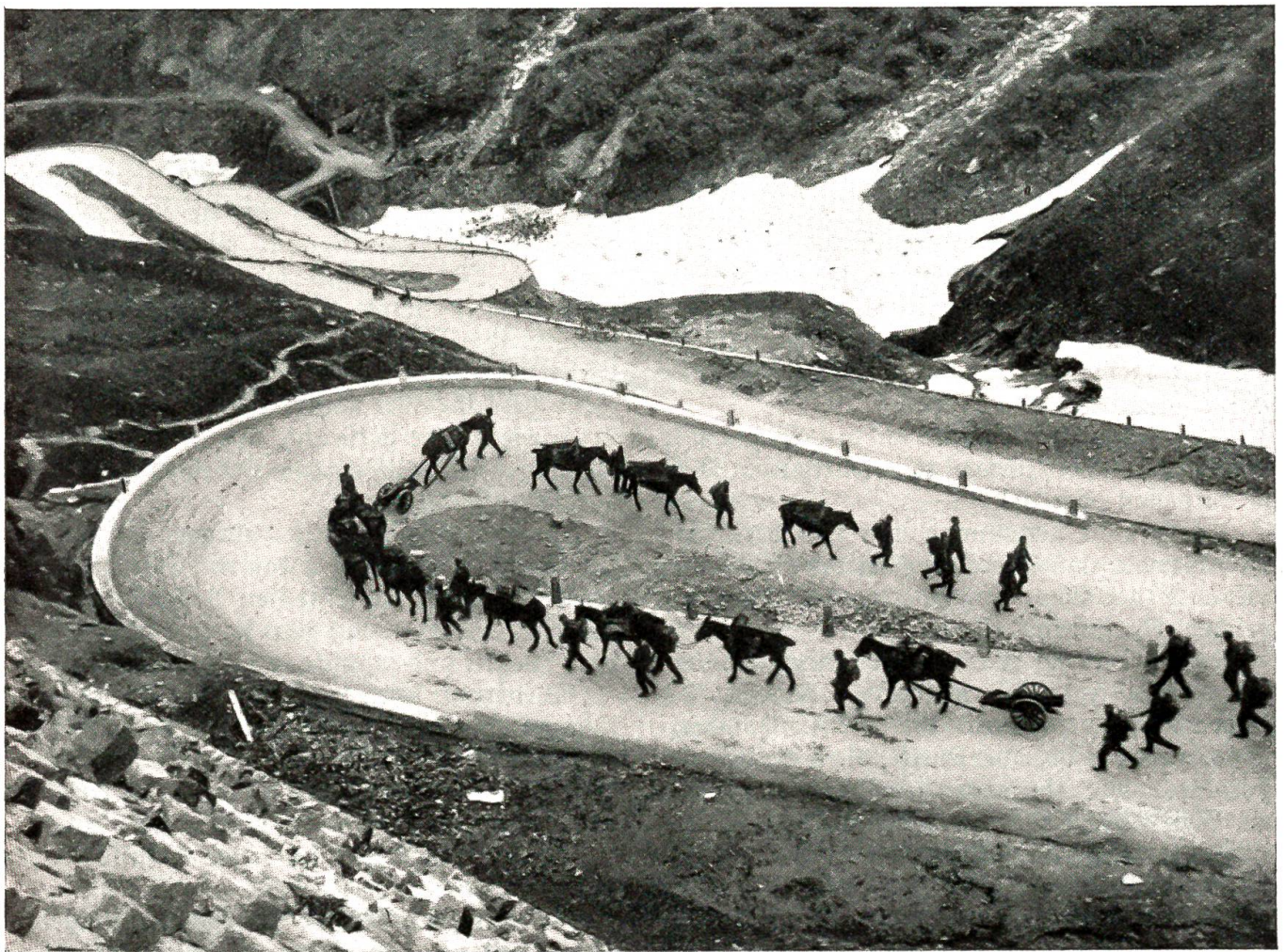
Gebirgsartillerie auf dem Gotthardpaß