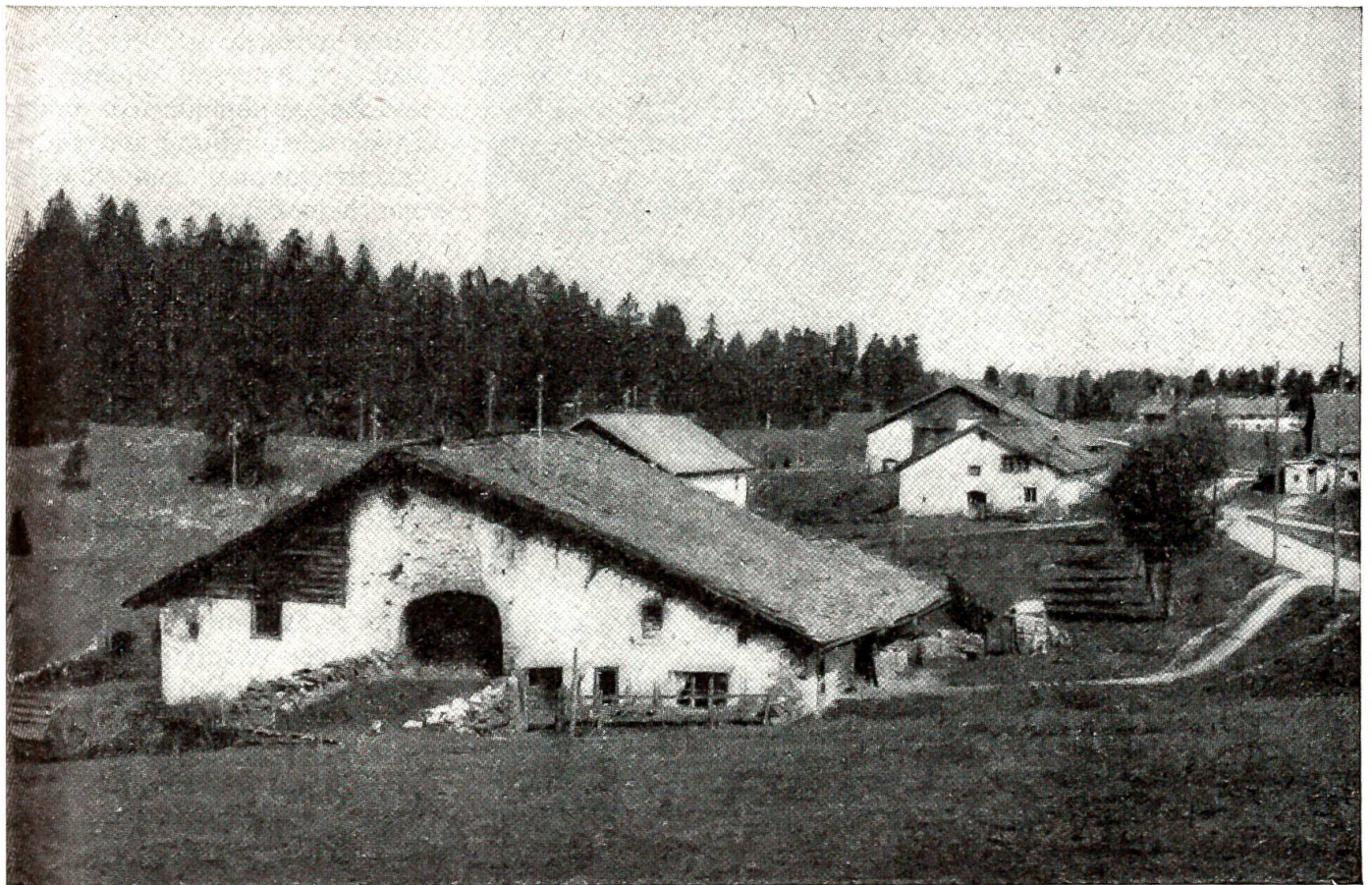
Das jurassische Bauernhaus in den Freibergen

derlein unter Zittern. „Halts Maul oder ich werfe dich in die Schlucht!“ war dessen Antwort. „Du hast's gewünscht, dein Wunsch ist erfüllt. Aber du mußt mir zuvor meinen Bart abschneiden“, so lautete die seltsame Antwort. Wenn's weiter nichts ist, dachte der Schneider für sich, warum nicht? Er faßte den Bock herzhast bei seinem Bart, und mit seiner Zuschneidschere, die er immer mit sich trug, schnitt er ihm den Bocksbart ab. Mit fürchterlichem Gelächter verschwand der Grauenhafte wie weggeblasen, und verdukt stand das Schneiderlein da, in der einen Hand den Bart, in der andern seine große Schere. Er wollte den Bart wegschmeißen — aber o Schrecken, er konnte die Faust nicht öffnen, und plötzlich klebte der an seinem Kinn, als hätte er immer dort gestanden. Alles Reißen und Zupfen nützte nichts, er war wie angewachsen. So gut es ging ohne