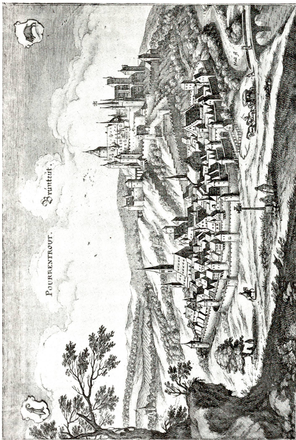
Anſicht der Stadt Brüntrut, die mit ihren Mauern und Thürmen noch lange den mittelalterlichen Bauchaſter bewahrt hat. Auf dem Schloßberg das Palais des Biſchofs und der Sitz der fürſtlichſchönen Verwaltung des Jura

Kupferſtich aus der Topographie von Matthäus Merian 1642