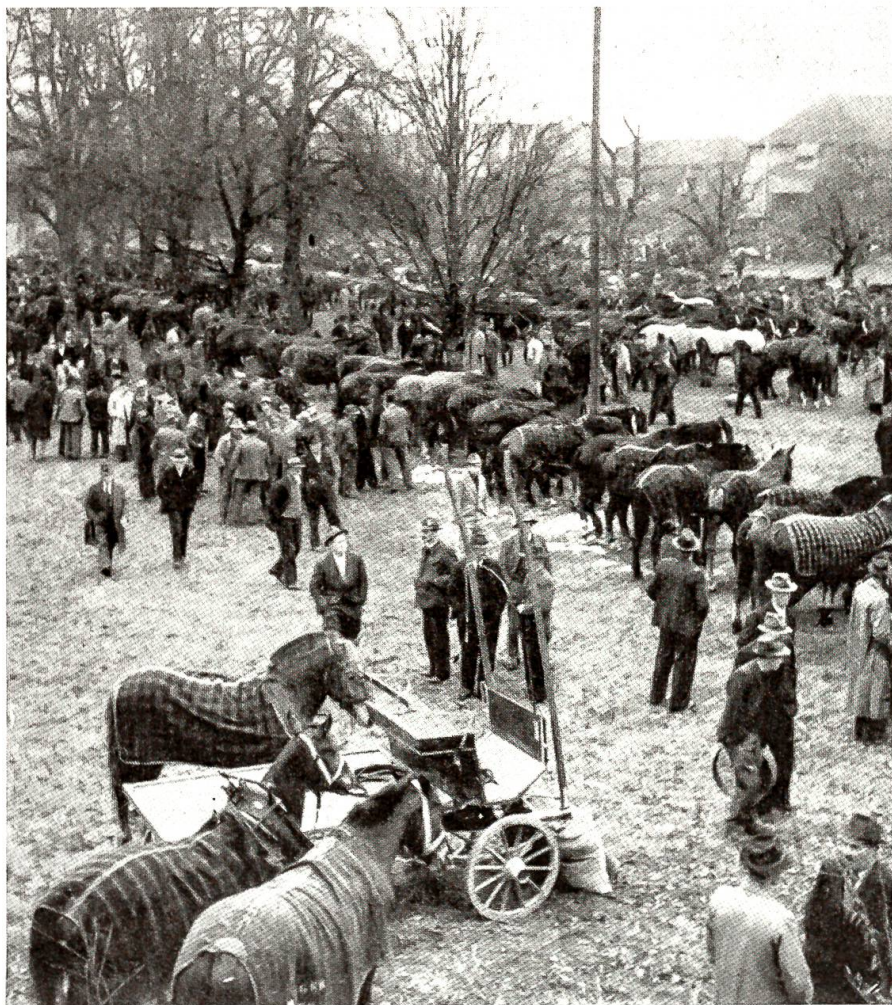
Das inländische Zuchtpferd ist immer noch sehr begehrt. Überblick auf den Inlandpferdemarkt in Narberg

Der Bart mußte weg, koste es, was es wolle, so beschloß der arme Schneider. Der Zufall kam ihm zu Hilfe. Auf einem seiner Kundenwege sah er eines Tages Caticus, den verhaßten Hauptmann des Grafen, in tiefem Schlafe unter einem Baume liegen. Mit Hilfe eines Spiegels, das er immer auf sich trug, seit ihm dieser abscheuliche Bart wuchs, schnitt er sich den Teufelsbart so sorgfältig und säuberlich wie nur immer möglich ab, und mit den Worten: „Aleb hier, in Teufels Namen!“, hielt er ihn