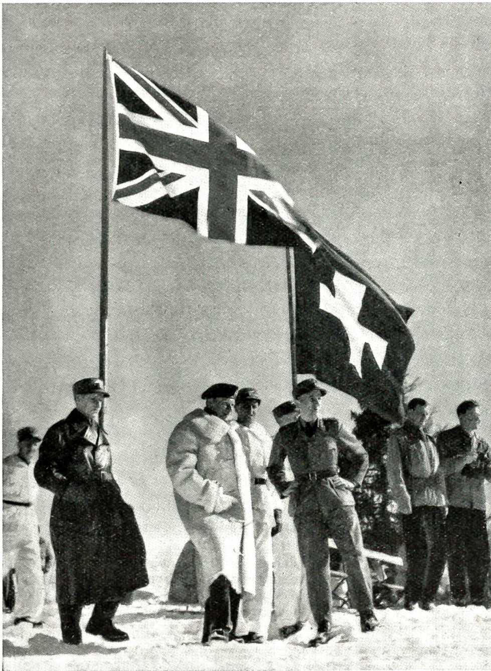
Feldmarschall Montgomery auf dem Gstaader Feldherrenhügel