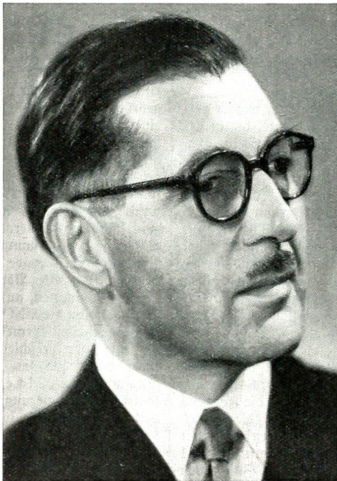
Karl Kobelt Bundespräsident für das Jahr 1946

sichtlich entscheidend zur Abkürzung des Krieges im Fernen Osten bei. Am 8. August, zwei Tage nach dem Abwurf der ersten Atombombe, erklärte die Sowjetunion Japan plötzlich den Krieg und ließ kurz darauf die Rote Armee in die Mandschurei einmarschieren. Am 10. August, am Tage nach dem Abwurf der zweiten Bombe, richtete dann die japanische Regierung durch Vermittlung der Schweiz und Schwedens ein Kapitulationsangebot an die alliierten Mächte, das nach Vereinbarung bestimmter Bedingungen schließlich angenommen wurde. Bereits am 14. August verkündeten Truman und der britische Ministerpräsident Attlee das Ende des Krieges im Fernen Osten. In den letzten Augusttagen begannen hierauf die alliierten Truppen mit der Besetzung der japanischen Stamminsel, und am 2. September wurde in der Bucht von Tokio an Bord des amerikanischen Schlachtschiffs „Missouri“ die bedingungslose Kapitulation Japans von der neuen japanischen Regierung im Namen des japanischen Kaisers unter-