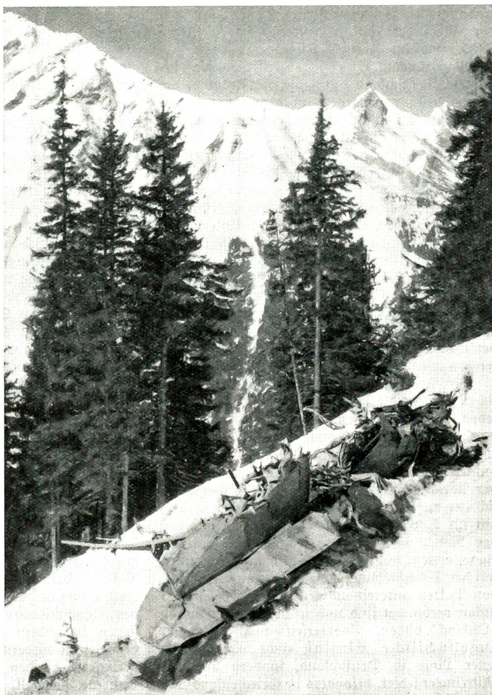
Eine Gruppe von vier Militärflugzeugen stürzte im Grimfelgebiet bei Guttannen ab. Am steilen Berghang des Benzlauistodes konnten die Flugzeugüberbleibsel mittels einer improvisierten Standseilbahn zu Tal gebracht werden.

ihre im Krieg neu erlangten machtpolitischen Positionen zu festigen und auszubauen. Könnten diese Ansprüche allein auf Kosten der Besiegten