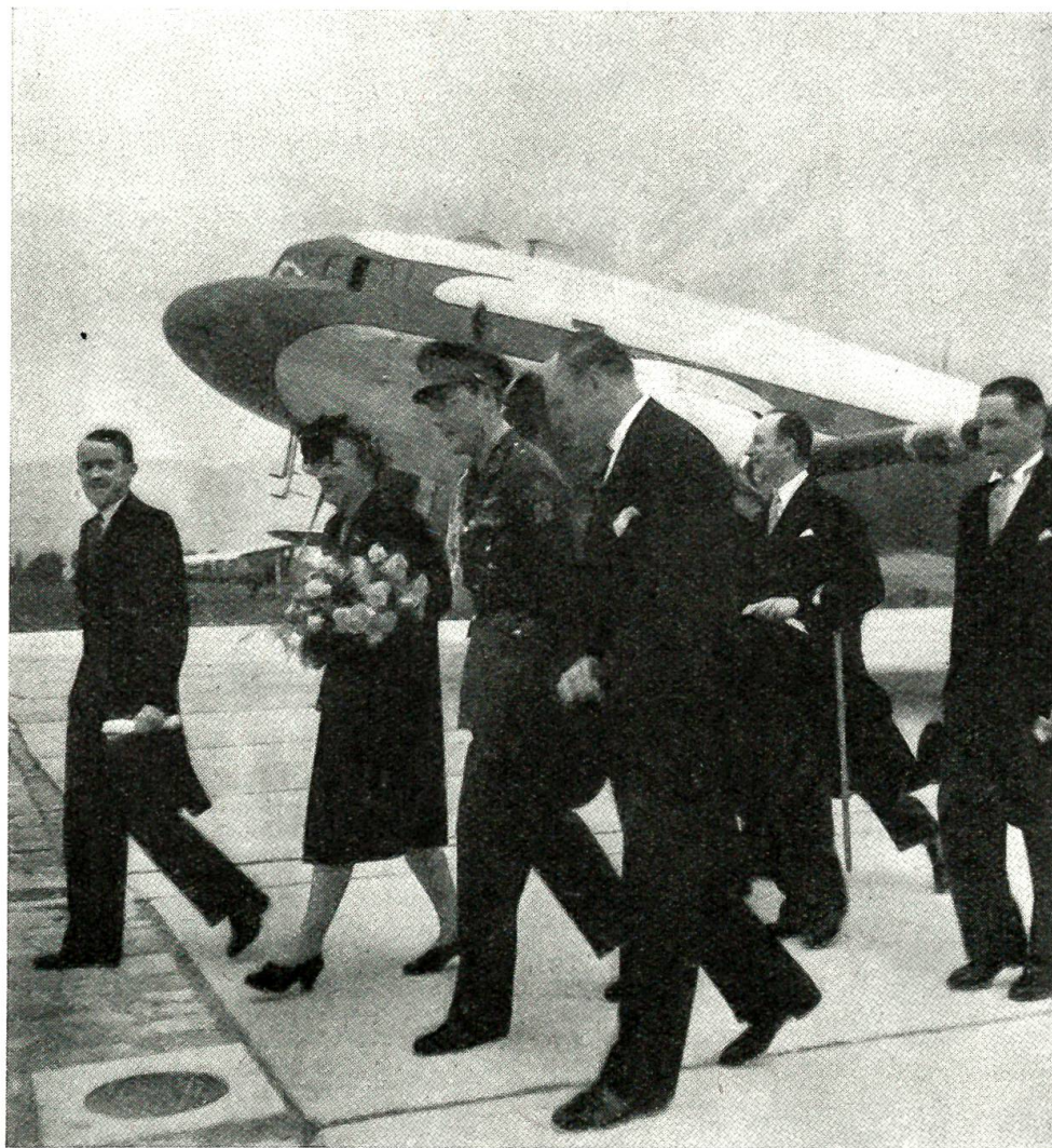
Prinzessin Juliane und Prinz Bernhard der Niederlande auf offiziellem Besuch in der Schweiz. Auf dem Flugplatz Cointrin in Genf werden die Gäste von Bundesrat Petitpierre (links) und dem holländischen Gesandten in der Schweiz, Minister Bosch v. Rosenthal (rechts vorne), empfangen.

Im übrigen sind die für die Zukunft wichtigen Entscheidungen bisher noch nicht im Rahmen der UNO gefallen, sondern in jenen Konferenzen, in denen die siegreichen Großmächte im engsten Kreise und hinter verschlossenen Türen berieten. An erster Stelle ist hier die Konferenz von Potsdam zu nennen. Sie wurde am 17. Juli zwischen Truman, Churchill, der nach den englischen Wahlen durch Attlee abgelöst wurde, und Stalin sowie ihren Außenministern und militärischen Beratern eröffnet und am 1. August mit einer grundlegenden Erklärung abgeschlossen. Diese enthielt Beschlüsse über die Einsetzung eines Außenministerrates der fünf Hauptmächte zur Vorbereitung der Friedensverträge, über die Behandlung Deutschlands und über seine Reparationsleistungen, über die Westgrenze Polens und die Abtretung Königsbergs an Rußland sowie über die Umsiedlung der Deutschen aus Polen, der Tschechoslowakei und Ungarn. Die sich hier abzeichnende Tendenz, die Hauptfragen der neuen Friedensordnung ohne Befragung der kleineren