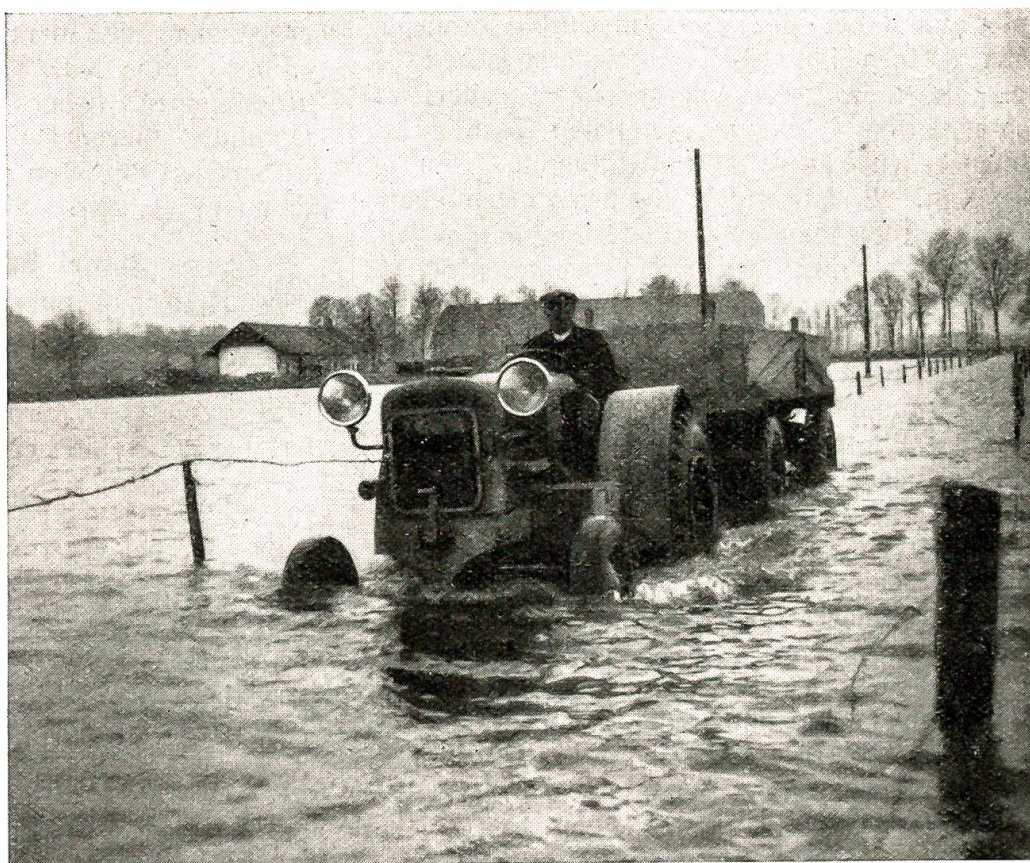
In der Domäne Wigwil stand im November 1944 kilometerweit das Wasser bis 1 m hoch über den Feldern. Mit Traktoren und Booten mußte der Verkehr nach den abgeschnittenen Höfen unterhalten werden.

Hinter all diesen mehr die Außenpolitik betreffenden Ereignissen treten die innenpolitischen Vorgänge an Bedeutung zurück. Erwähnt sei zunächst der am 10. November wohl teils in Zusammenhang mit der russischen Absage erfolgte Rücktritt von Bundesrat Pilet-Golaz, dem Vorsteher des politischen Departements. Zu seinem Nachfolger wählte die Bundesversammlung im Dezember den neuenburgischen Ständerat Max Petitpierre. Sodann hat der Chronist zu berichten, daß das Schweizervolk trotz der Kriegswirren vor den Landesgrenzen zweimal an die Urnen gerufen wurde: am 29. Oktober