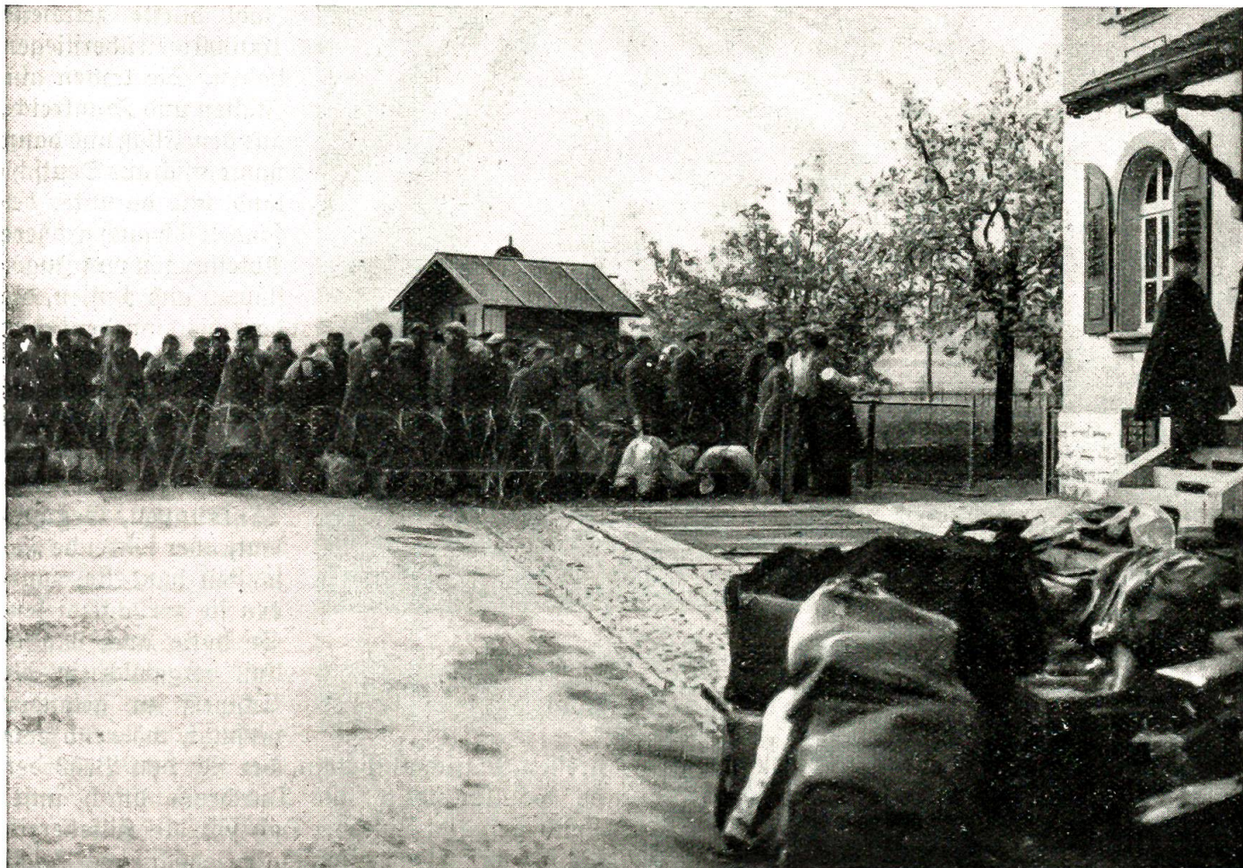
Der Flüchtlingsstrom aus dem Norden: Flüchtlinge warten auf den Übertritt

5. September sogar eine Teilkriegsmobilisierung notwendig. Die Neutralitätsverletzungen durch fremde, meist alliierte Flieger gehörten während Monaten zu den fast täglichen Ereignissen; am 12. September allein wurden 65 Grenzverletzungen innerhalb von 24 Stunden ge-