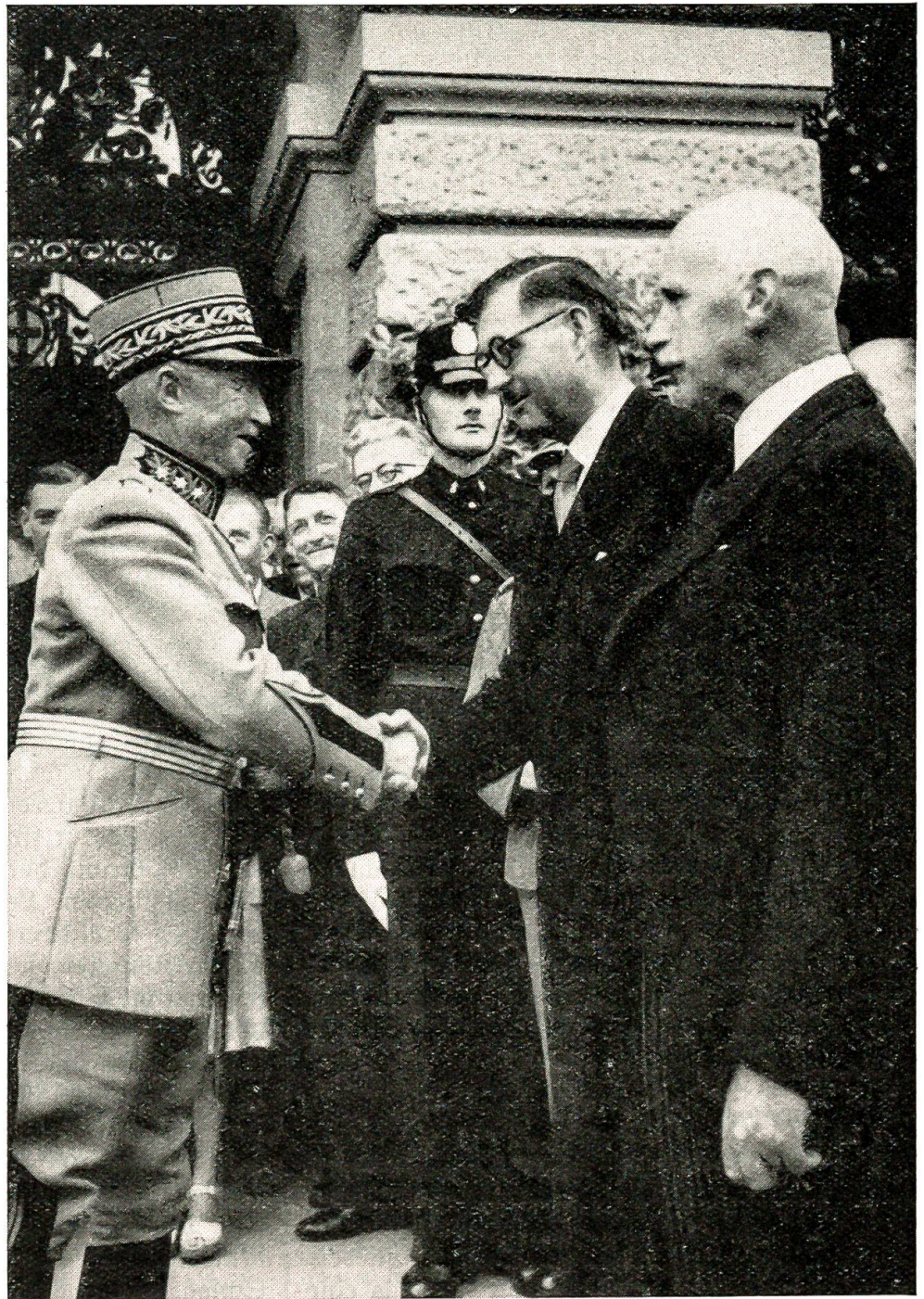
Abschied des Generals vor der Vereinigten Bundesversammlung, Mittwoch, den 20. Juni 1945. General Guisan verabschiedet sich vor dem Bundeshaus von Bundesrat Kobelt und Nationalratspräsident Nef (rechts).

mit der Begründung abgelehnt, daß die Kapitulation bedingungslos gegenüber allen Alliierten,