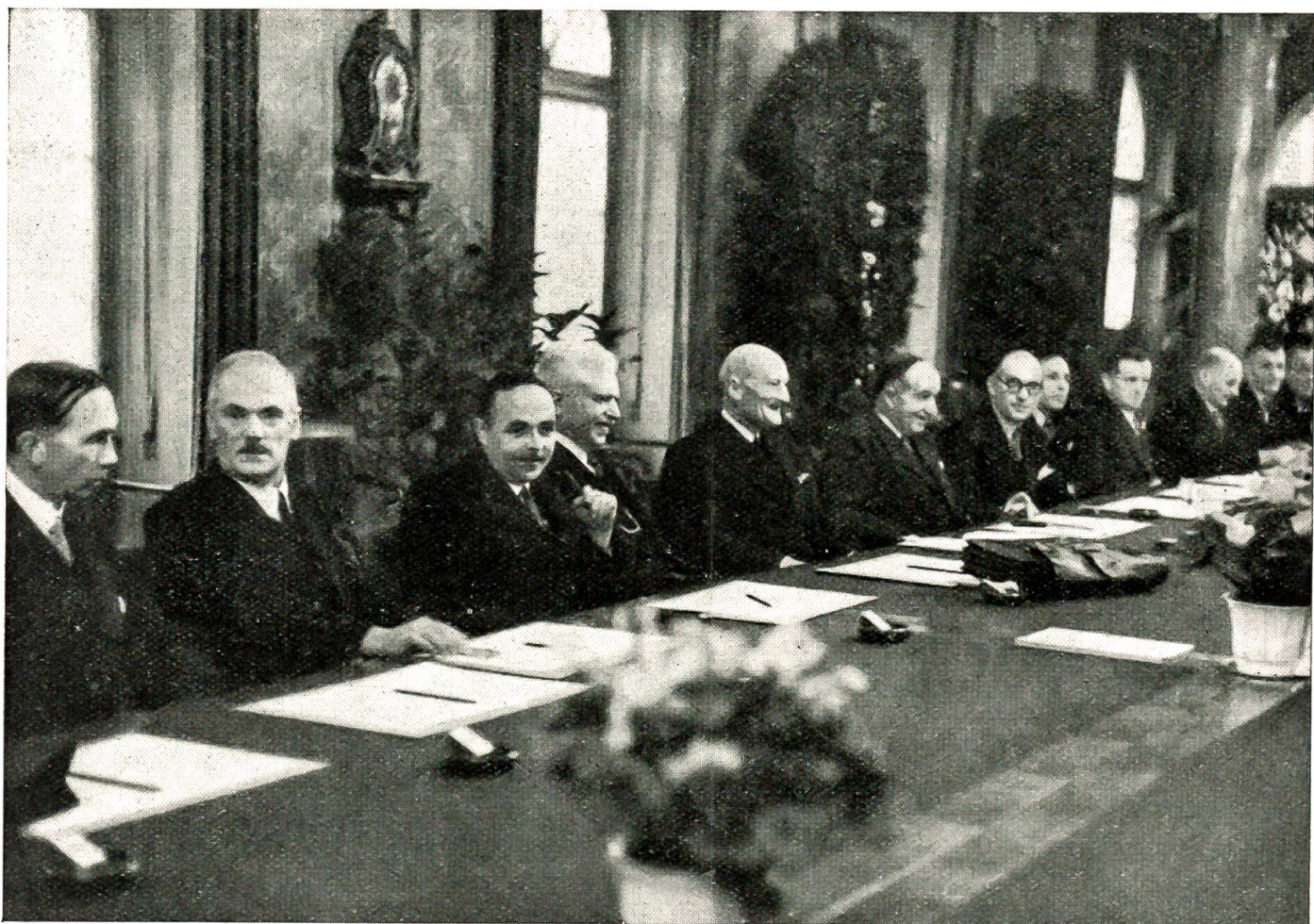
Schweizerisch-alliierte Wirtschaftsverhandlungen: die Vertretung der Schweiz an der Eröffnungssitzung