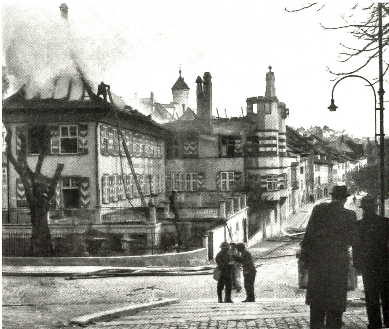
Das bekannte Restaurant Tiergarten in Schaffhausen, dessen Dachstod vollkommen ausgebrannt ist Z. Nr. VI Br. 14965

Drei Staffeln amerikanischer viermotoriger Bomber flogen in großer Höhe von Osten heran. Die erste, bestehend aus einem guten Duzend Maschinen, warf keine Bomben ab. Aus der dicht aufgeschlossenen, etwa 20 Bomber zählenden zweiten entsprang ein Leuchtsignal mit langer Rauchfahne. Kurz darauf prasselten eine Menge Bomben über das Gebiet von Unterschlatt-Kohlfirst-Flurlingen herab. Bei der dritten Staffel von 24 Bombern dasselbe Rauchsignal. Es sollte der Stadt Schaffhausen zum Verhängnis