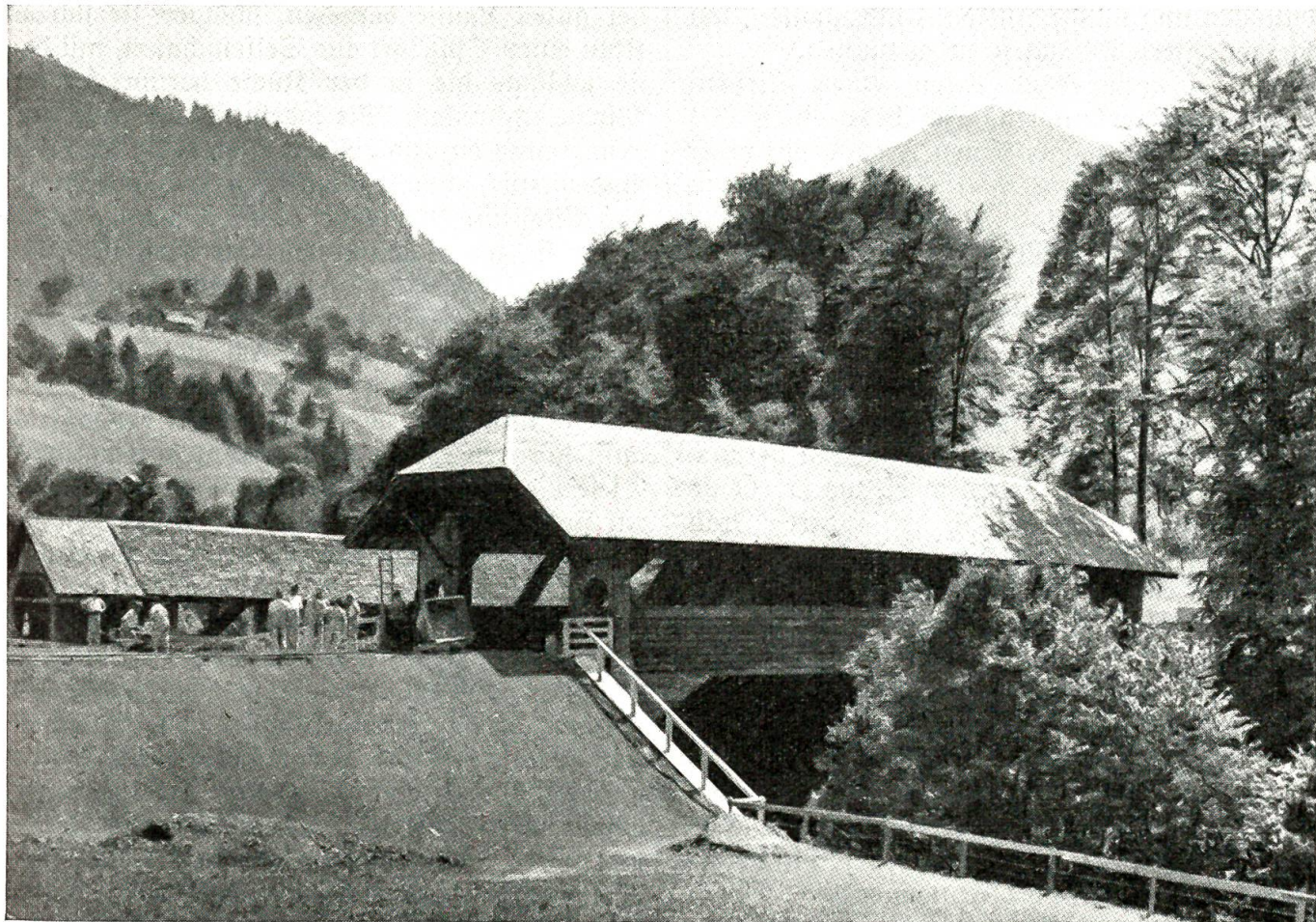
Die höchste Holzbrücke Europas wurde über das Melchaatobel zwischen Glüeli und Kerns neu erstellt

Der Siebenschläfer legt am Abend gewöhnlich einen Zettel auf den Flur: Bitte dringend wecken! Am Morgen klopft sich die Wirtin die Knöchel wund, während der Siebenschläfer gerade dabei ist, einen knorrigen Ist durchzusagen. Man könnte ihm einen Eimer mit eiskaltem Wasser auf den